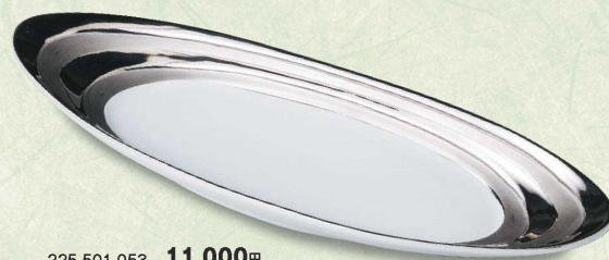
225-501-053 11,000円 プラチナ楕円大皿(38×13.3×4)