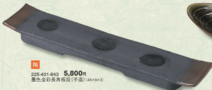
陶 225-401-843 5,800円 墨色金彩長角板皿(手造)(45×9×3)