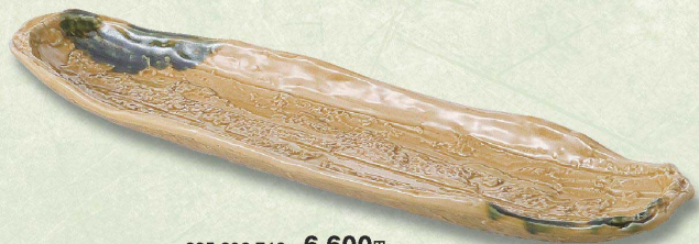
225-202-743 6,600円 黄瀬戸楕円皿(46×11.3×3)