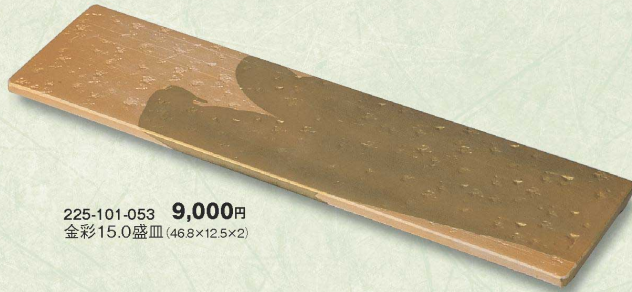
225-101-053 9,000円 金彩15.0盛皿(46.8×12.5×2)