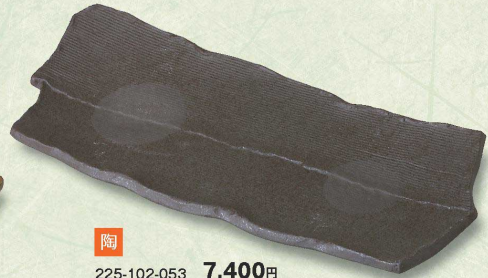
陶 225-102-053 7,400円 炭化土線段12.0皿(37×15×4.5)