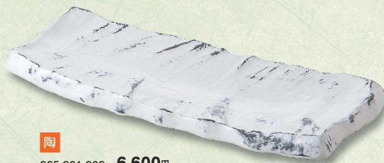
陶 225-301-303 6,600円 粉引拭取りガタ彫12.0皿(37×14.5×4)