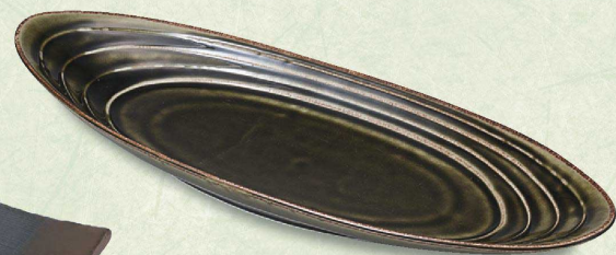
225-402-053 4,800円 糸根織部釉楕円鉢(38×13×4)