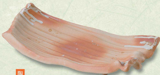
陶 225-201-053 7,200円 焼しめ灰釉11.0長皿(35×15.5×7)