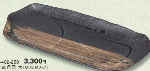
226-402-253 3,300円 流木長角皿 大 (35.8×16.3×2)