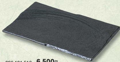
226-101-513 6,500円 コーカイ黒長角皿(大) (30.5×20×2)