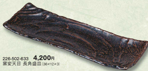
226-502-633 4,200円 窯変天目 長角盛皿 (36×12×3)