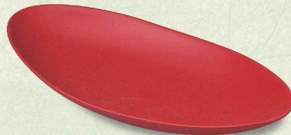
226-103-263 5,000円 700nm 34.5cmオーバル (34.5×18.2×5.5)