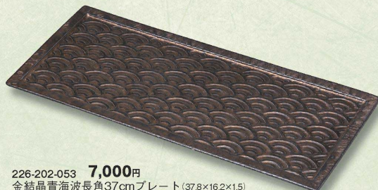
226-202-053 7,000円 金結晶青海波長角37cmプレート (37.8×16.2×1.5)