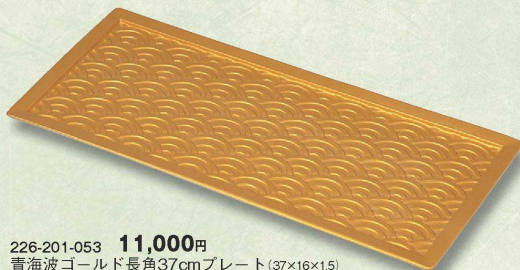
226-201-053 11,000円 青海波ゴールド長角37cmプレート (37×16×1.5)