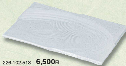
226-102-513 6,500円 コーカイ白長角皿(大) (30.5×20×2)