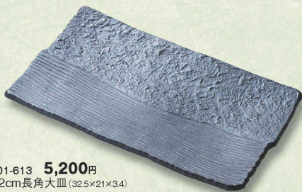
226-401-613 5,200円 黒楽32cm長角大皿 (32.5×21×3.4)