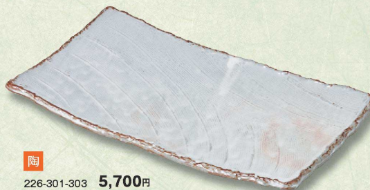
陶 226-301-303 5,700円 御本手クシメ12.0長角皿 (37.5×21.5×4.5)