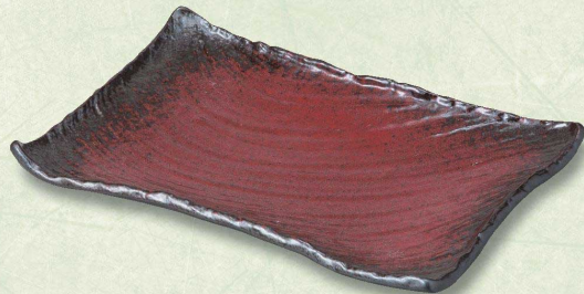
229-302-573 3,300円 朱雲 26cm角皿 (26×18×3.2)