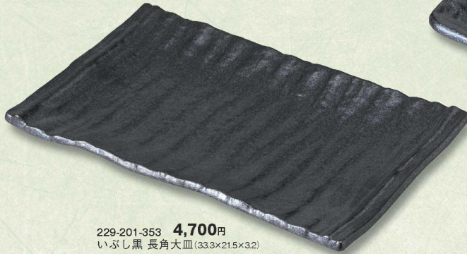
229-201-353 4,700円 いぶし黒 長角大皿 (33.3×21.5×3.2)