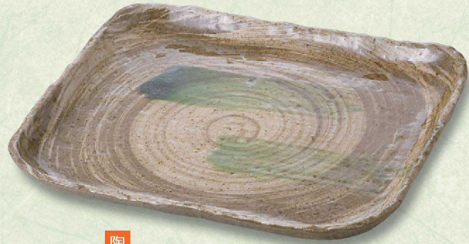
陶 229-102-513 4,000円 黄瀬戸四角大皿 (29.7×25.8×2.5)