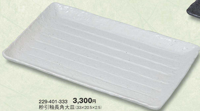
229-401-333 3,300円 粉引釉長角大皿 (33×20.5×2.5)