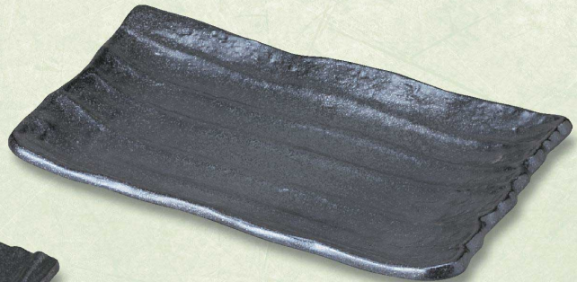
229-202-613 3,500円 しのぎ黒 長角大皿 (32.5×20×3.4)