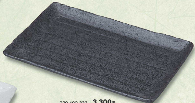
229-402-333 3,300円 黒結晶長角大皿 (33×20.5×2.5)