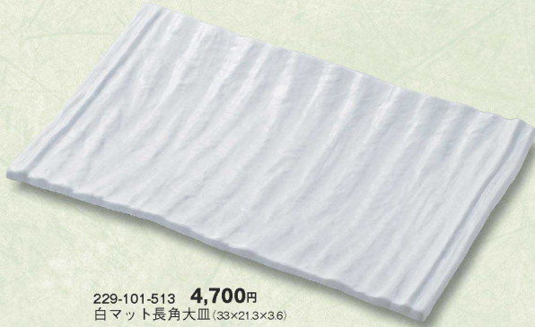
229-101-513 4,700円 白マット長角大皿 (33×21.3×3.6)