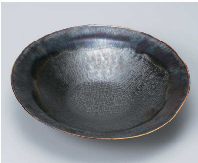
陶 230-201-053 7,800円 ナルガ29cmプレート (29×28.5×5)