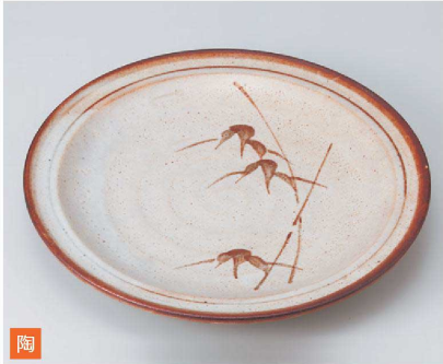
陶 230-101-303 14,000円 赤志野竹10.0皿 (30×4)