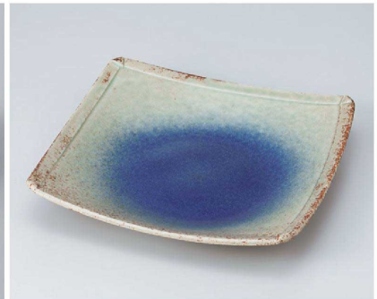
陶 230-403-263 3,100円 瑠璃角大皿 (25×25×4.8)