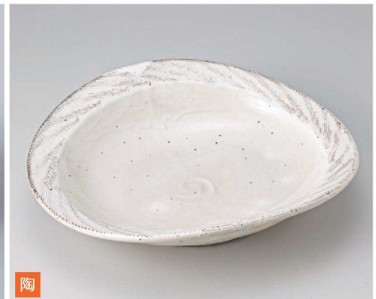
陶 230-203-073 5,500円 粉引くし目楕円盛皿 (27.5×25×6.8)