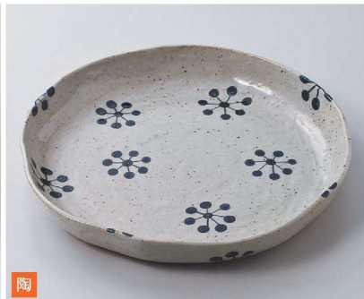
陶 230-202-783 7,100円 藍染9.0丸皿 (28×3.5)