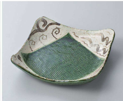
陶 230-402-253 3,900円 織部トチリ24cm正角鉢 (23.5×23.5×5.5)