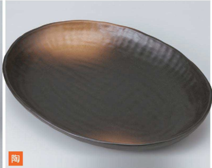
陶 230-103-513 6,600円 黒備前櫛目楕円大皿 (607006) (37×29×4.5)