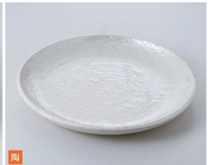
陶 230-303-743 5,620円 真珠9.0丸皿 (27.2×3)