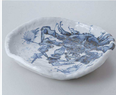
陶 230-102-053 9,400円 染付カニ絵変型10.0皿 (32×30×6.5)