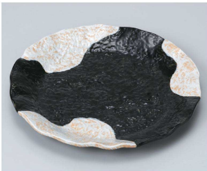
陶 230-301-513 5,000円 黒織部 波瀾大皿 (29.8×3.3)