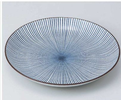
陶 230-302-473 5,400円 千段十草10.0皿 (31.2×4)