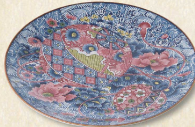
陶 235-204-823 4,800円 てまり12.0大皿(37×37×4.5) 235-205-823 3,200円 てまり10.0大皿(32×32×4)