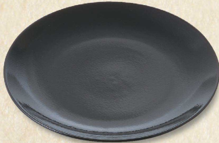
陶 235-201-813 7,700円 ゆず天目13.0丸皿(41.5×5.5) 235-202-813 4,000円 ゆず天目12.0丸皿(37×3.5) 235-203-813 3,500円 ゆず天目10.0丸皿(31.5×3)