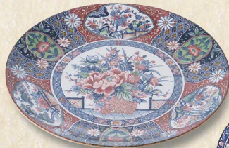
陶 235-401-813 3,500円 花かご10.0皿(31.5×3)