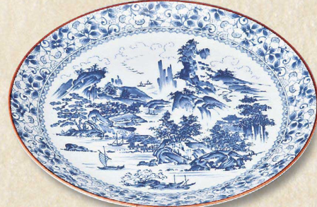
陶 235-302-823 7,000円 新古木山水13.0皿(42×42×5.5) 235-303-823 4,300円 新古木山水12.0皿(37×37×4.5) 235-304-823 2,600円 新古木山水10.0皿(32×32×4)