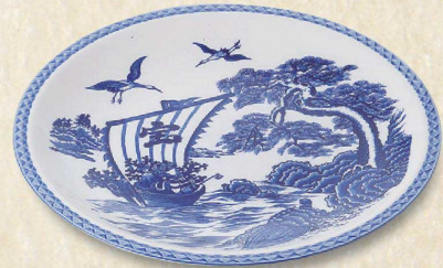
陶 235-206-823 4,300円 宝舟12.0大皿(36.5×36.5×4) 235-207-823 2,600円 宝舟10.0大皿(32×32×3.5)