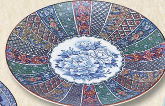
陶 235-403-813 3,500円 染錦10.0皿(31.5×3)