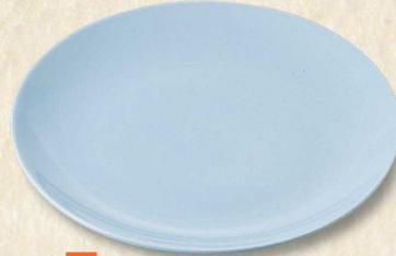
陶 235-103-843 4,200円 青地12.0皿(36×3.5) 235-104-843 2,500円 青地10.0皿(31.5×3)