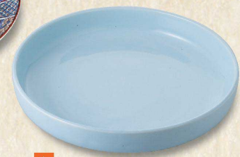
陶 235-404-813 4,000円 青磁10.0盛鉢(30×6)