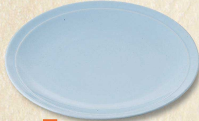
陶 235-101-813 4,400円 高台青磁12.0皿(38×4.5) 235-102-813 4,000円 高台青磁11.0皿(34.5×4)