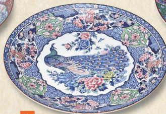
陶 235-402-813 3,500円 伊万里孔雀10.0皿(31.5×3)