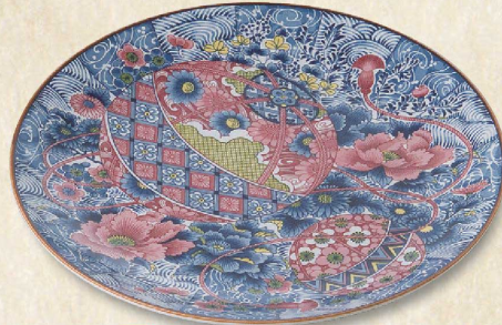
陶 235-301-823 8,300円 てまり13.0大皿(42×42×5.5)