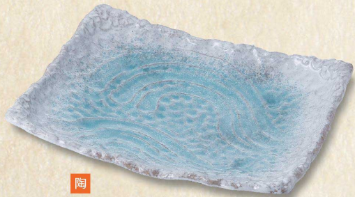
陶 236-201-813 4,300円 青雲10.0長角盛皿 (30×24×5)