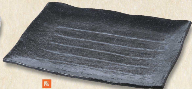
陶 236-403-823 5,900円 油滴天目12.0角皿 (37×26) 236-404-823 4,300円 油滴天目11.0角皿 (34×23.5) 236-405-823 3,200円 油滴天目10.0角皿 (30×21) 236-406-823 2,800円 油滴天目9.0角皿 (28.5×18.5)