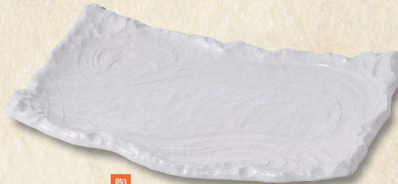
陶 236-301-843 3,000円 白釉四ツ足11.0長角皿 (33×18.5×5.5)