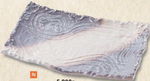
陶 236-401-823 5,200円 志野13.0長角足付 (37×25×5) 236-402-823 2,800円 志野11.0長角足付 (33×20×5)