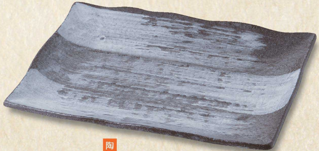
陶 236-202-823 5,900円 白刷毛目12.0角皿 (37×26) 236-203-823 4,300円 白刷毛目11.0角皿 (34×23.5) 236-204-823 3,200円 白刷毛目10.0角皿 (30×21) 236-205-823 2,800円 白刷毛目9.0角皿 (28.5×18.5)