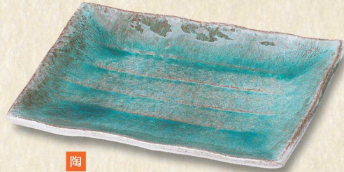
陶 236-103-813 3,200円 湖水10.0長角皿 (30.5×21×3.5)