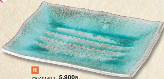
陶 236-101-813 5,900円 湖水12.0長角皿 (38×27×3.6) 236-102-813 4,300円 湖水11.0長角皿 (34.5×24×3.5)