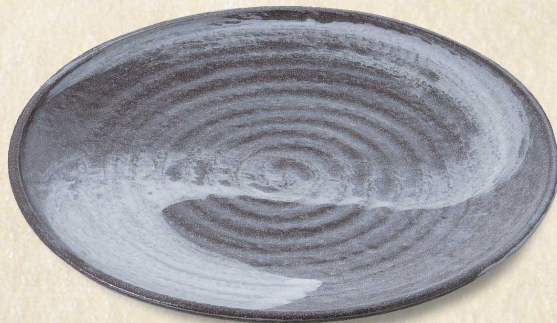
陶 238-301-823 5,900円 白刷毛目11.0丸皿 (33.5) 238-302-823 4,100円 白刷毛目10.0丸皿 (30.5) 238-303-823 3,500円 白刷毛目9.0丸皿 (27.5)