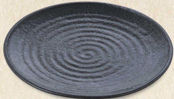
陶 238-304-823 5,900円 油滴天目11.0丸皿 (33.5) 238-305-823 4,100円 油滴天目10.0丸皿 (30.5)