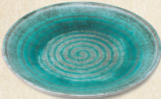
陶 238-201-813 5,900円 湖水11.0丸皿 (33.5×3.5) 238-202-813 4,100円 湖水10.0丸皿 (30.5×3)