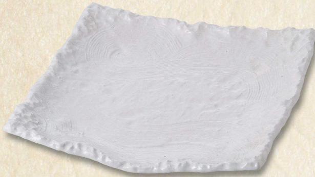
陶 238-101-843 4,000円 白釉四ツ足10.0正角皿 (30.5×30.5×5.5)