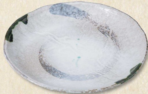
陶 238-203-813 5,200円 織部流10.0大皿 (30×4.5)