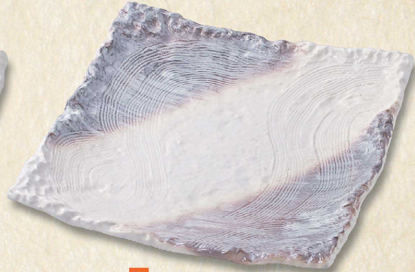
陶 238-102-823 3,800円 志野10.0四方皿 (31.5×31.5×5.5) 238-103-823 2,600円 志野8.0四方皿 (26×26×5)