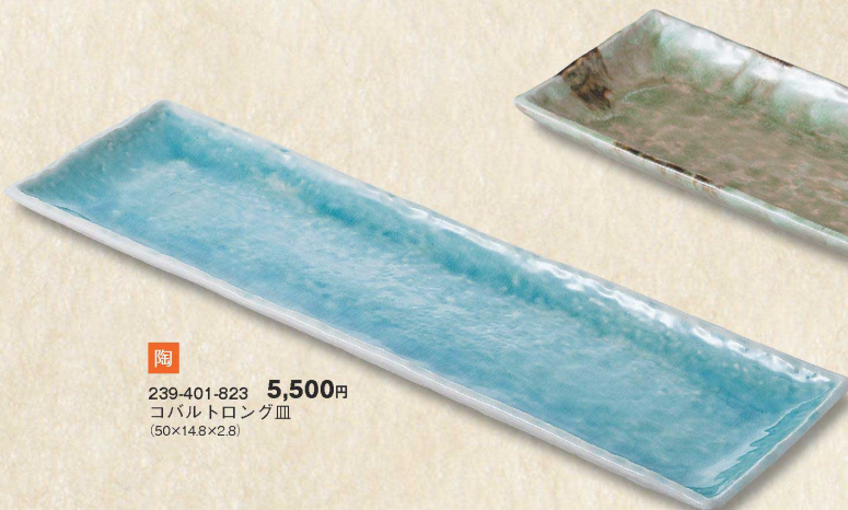
陶 239-401-823 5,500円 コバルトロング皿 (50×14.8×2.8)