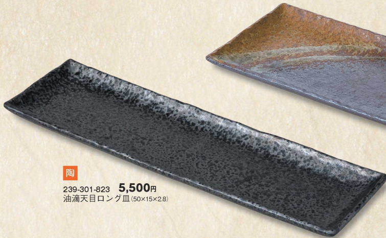
陶 239-301-823 5,500円 油滴天目ロング皿(50×15×2.8)