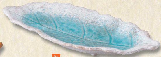
陶 239-103-813 3,900円 青海木ノ葉盛皿(40×17×6) 239-104-813 2,200円 青海10.0木ノ葉皿(33.5×14.5×3.8)