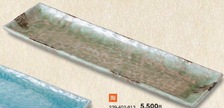
陶 239-402-813 5,500円 砂ビードロ50cmロング皿 (50×15×2.8)