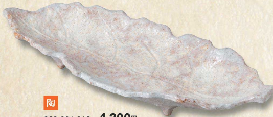
陶 239-201-813 4,200円 粉引木ノ葉盛皿(40×17×6)