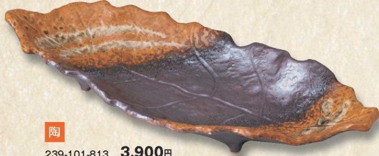
陶 239-101-813 3,900円 備前一珍木の葉盛皿 大(40×17×6) 239-102-813 2,200円 備前一珍木の葉盛皿 中(33.5×14.5×3.8)