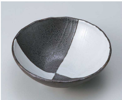
24-201-703 2,500円 古代市松向付 (15.4×5)