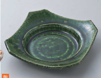
陶 24-402-523 2,150円 織部 角向付 (17×3.8)