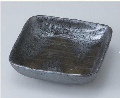
24-202-513 2,100円 南蛮Nライン5.5角鉢 (16×16×4.8)