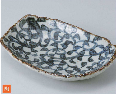
陶 24-101-053 2,900円 タコ唐草中鉢 (22×14.5×4.5)