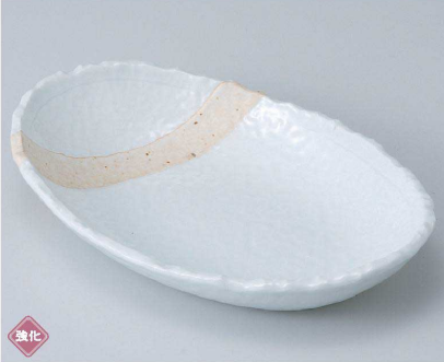
強化 24-103-703 2,130円 粉引塗分け6.5楕円ボール (19.8×13.1×3.7)