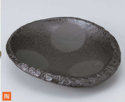
陶 24-102-513 2,350円 炭化土丸向付 (605015) (19.4×18×4.5)