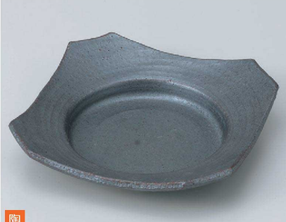
陶 24-403-523 2,150円 南蛮 角向付 (17×3.8)