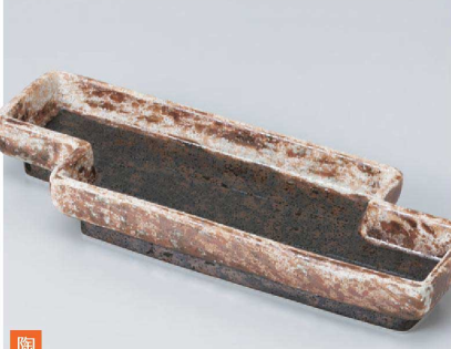
陶 24-401-513 2,180円 黒伊賀カイラギハツ橋付出皿 (24.5×9.2×3.7)