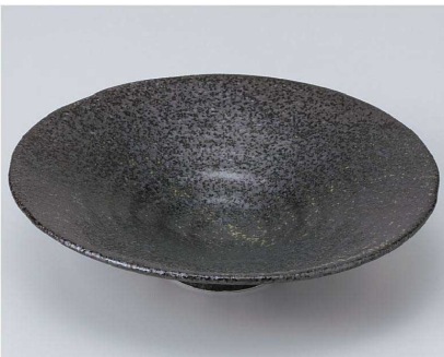
24-303-613 2,200円 いぶし黒 6.0平鉢 (19×4.6)