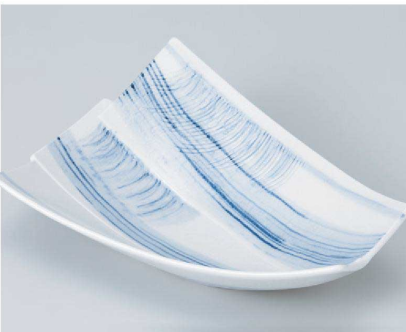
24-203-053 2,700円 青呉須貼合せ三角向付 (18.5×14.2×6)