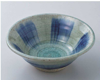
24-301-783 2,700円 御深井ゴス刷毛5.5平鉢 (16.7×5.7)