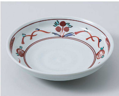
24-302-053 2,200円 手描赤絵5.0向付 (16.3×4.2)