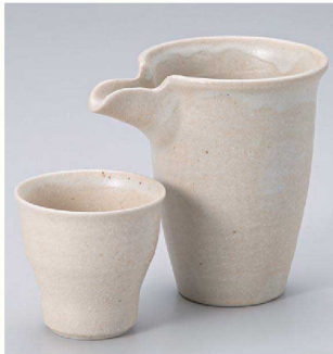
243-103-263 2,900円 粉引風冷酒器(11.7×8.8×290cc) 243-104-263 1,100円 粉引風冷酒盃(6.5×6×110cc)