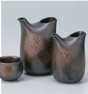
243-403-743 1,750円 黒曜徳利(大)(8.7×11.6×350cc) 243-404-743 1,050円 黒曜徳利(小)(7.4×10×230cc) 243-405-743 610円 黒曜グイ呑(5.4×4.1×50cc)