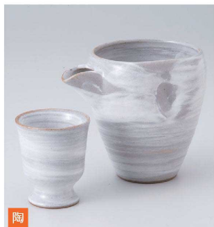
243-201-573 2,550円 粉引刷毛目冷酒器(9.5×10.5×360cc) 243-202-573 1,200円 粉引刷毛目冷酒カップ(5.9×6.7×90cc)