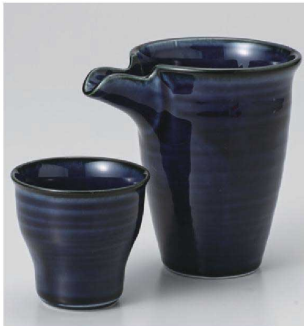
243-105-523 3,000円 ナス紺冷酒器(11.2×8.8×320cc) 243-106-523 1,070円 ナス紺冷酒盃(6.5×6.2×110cc)