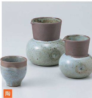
243-301-573 2,800円 唐津冷酒器(大)(10.5×11×500cc) 243-302-573 2,400円 唐津冷酒器(小)(8×9×250cc) 243-303-573 1,050円 唐津長ぐい呑(6×6×90cc)