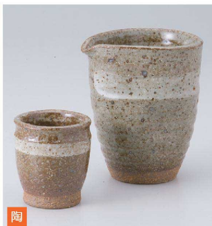
243-203-523 2,200円 土灰釉冷酒器(9.5×7.8×11×300cc) 243-204-523 1,030円 土灰釉冷酒盃(5.7×6.5×80cc)