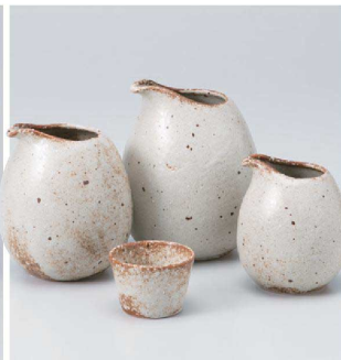
243-308-603 1,750円 サビ志野冷酒器(大)(8.3×10.2×320cc) 243-309-603 1,500円 サビ志野冷酒器(中)(7.5×8.7×240cc) 243-310-603 1,400円 サビ志野冷酒器(小)(6.7×7.4×120cc) 243-311-603 730円 サビ志野ぐい呑(小)(4.8×3.2×25cc)