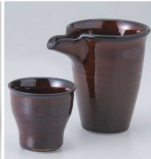
243-107-523 3,000円 うるし釉冷酒器(11.2×8.8×320cc) 243-108-523 1,070円 うるし釉冷酒盃(6.5×6.2×110cc)