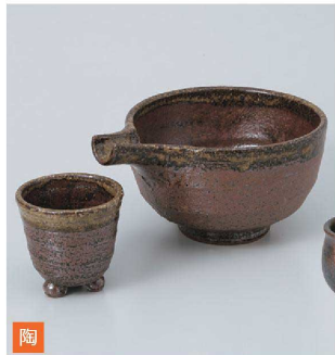
243-401-333 2,100円 備前流冷酒注器(18×13.5×8.5×450cc) 243-402-333 1,500円 備前流三ッ足グイ呑(7×6.8×100cc)