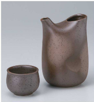
243-406-523 1,700円 備前吹冷酒器(8.7×11.6×350cc) 243-407-523 600円 備前吹盃(5.5×4.1×60cc)