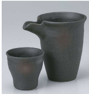
243-101-263 2,900円 備前風冷酒器(11.7×8.8×290cc) 243-102-263 1,100円 備前風冷酒盃(6.5×6×110cc)