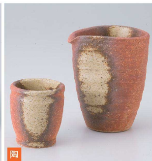
243-207-523 2,200円 伊賀火色冷酒器(9.5×7.8×11×300cc) 243-208-523 1,030円 伊賀火色冷酒盃(5.7×6.5×80cc)