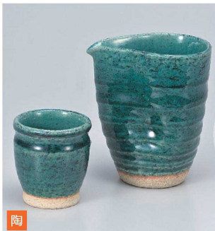
243-306-163 2,100円 清海片口冷酒器(9.8×7.5×11×2×320cc) 243-307-163 980円 清海冷酒盃(5.8×6.4×80cc)