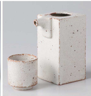
243-408-603 2,100円 サビ志野角冷酒器(9×6.1×11.7×300cc) 243-409-603 750円 サビ志野切立ぐい呑み(5×5.3×70cc)