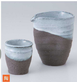
243-304-163 2,100円 黒白釉掛冷酒器(9.5×8.2×11×300cc) 243-305-163 980円 黒白釉掛冷酒盃(5.7×6.5×80cc)