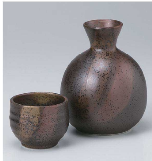
245-401-153 1,500円 備前風丸徳利(350cc) 245-402-153 500円 備前風ぐい呑(5.7×4.6×70cc)