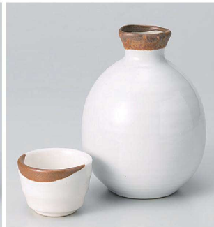
245-407-573 1,150円 白金流玉大徳利(9.5×12.3×450cc) 245-408-573 330円 白金流ぐい呑(5.3×4×50cc)