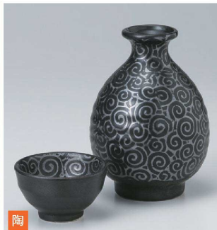
陶 245-203-523 2,000円 銀彩黒唐草玉徳利(9×12×360cc) 245-204-523 820円 銀彩黒唐草グイ呑(6.5×3.9×60cc)