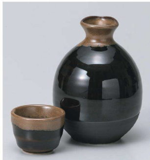
245-405-573 1,150円 天目金流玉大徳利(9.5×12.3×450cc) 245-406-573 330円 天目金流ぐい呑(5.3×4×50cc)