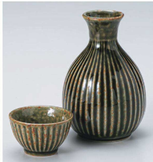
245-303-013 1,650円 ソギ徳利 織部イラボ(12.8×9×300cc) 245-304-013 580円 ソギ盃 織部イラボ(6×4×50cc)