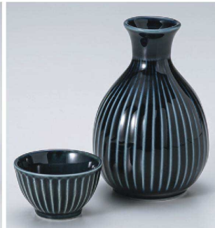
245-307-013 1,650円 ソギ徳利 紺(12.8×9×300cc) 245-308-013 580円 ソギ盃 紺(6×4×50cc)