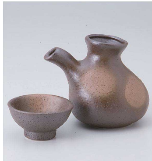
245-301-573 1,750円 黒伊賀冷酒器(290cc) 245-302-573 630円 黒伊賀平ぐい呑(6.7×3.7×50cc)