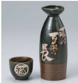
245-403-163 1,280円 酒は百葉長徳利(4.3×16×300cc) 245-404-163 420円 酒は百葉長盃(5.5×4.3×60cc)