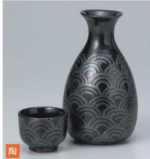
陶 245-105-253 2,300円 黒銀彩青海波2合徳利(8×14.5×300cc) 245-106-253 1,750円 黒銀彩青海波1合徳利(7×11.9×220cc) 245-107-253 880円 黒銀彩青海波盃(5.2×4.45cc)