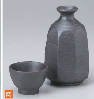
陶 245-108-543 2,400円 黒備前八角徳利(7.5×12.5×350cc) 245-109-543 1,200円 黒備前八角ぐい呑(6×4.5×60cc)