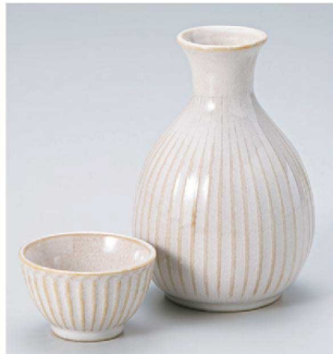
245-305-013 1,650円 ソギ徳利 うのふ(12.8×9×300cc) 245-306-013 580円 ソギ盃 うのふ(6×4×50cc)