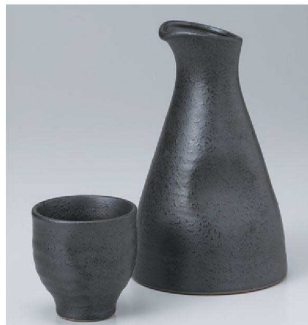
245-201-253 2,360円 いぶし黒釉大徳利(9.5×15.5×420cc) 245-202-253 1,260円 いぶし黒釉ぐい呑(6×6×100cc)