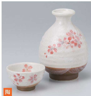
陶 245-205-523 1,700円 平安桜 玉徳利(9×12×360cc) 245-206-523 700円 平安桜 グイ呑(6.5×3.9×60cc)