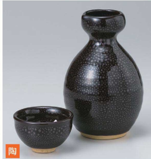
陶 245-103-333 2,600円 油滴天目 徳利(8.6×13.3×300cc) 245-104-333 950円 油滴天目 ぐい呑(6.8×4.50cc)