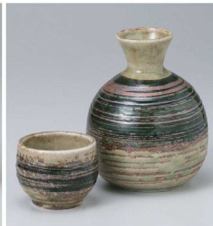
245-207-243 1,500円 ローウス徳利(9×11.3×350cc) 245-208-243 480円 ローウス盃(5.8×4.5×70cc)