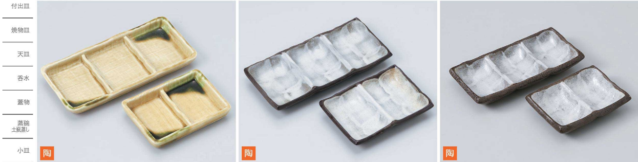
270-105-473 1,700円 やきしめ三品皿 (20.5×9.5×2.2) 270-106-473 1,300円 やきしめ二品皿 (15.9×2.2)