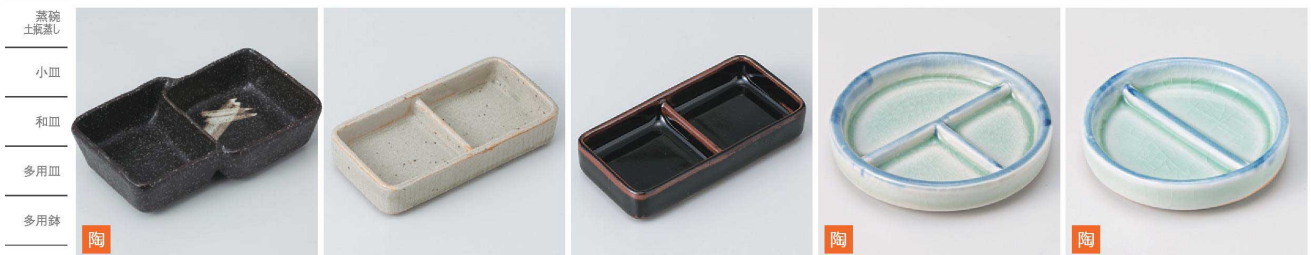
盛込鉢 276-301-603 950円 天正黒角二品盛り (14.5×8.5×3.5) 276-302-783 850円 仕切薬味皿まじこ (10.6×5.4×2) 276-303-783 850円 仕切薬味皿天目 (10.6×5.4×2) 276-304-743 730円 御深井丸三品皿 (10×1.7) 276-305-743 680円 御深井丸二品皿 (8.7×1.7)