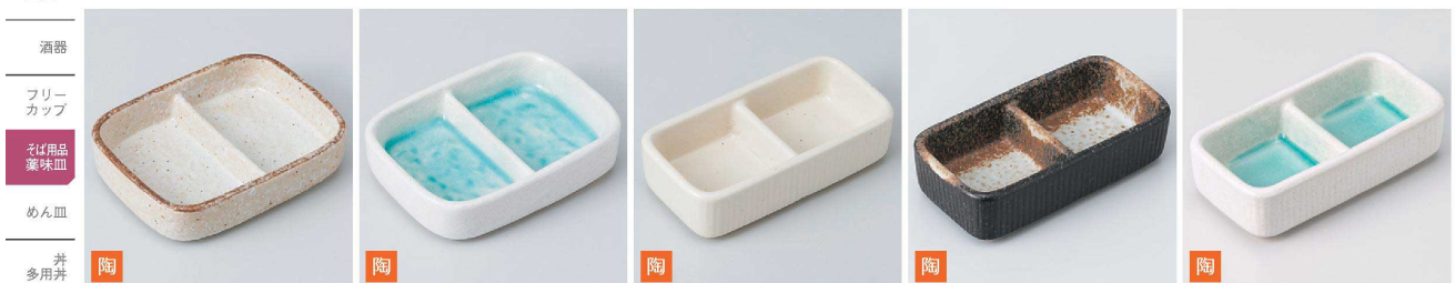
流仕見換 特選 276-401-793 600円 瀏さび二品皿 (10.3×7.7×2.3) 276-402-793 600円 白流水二品皿 (10.6×8×2.4) 276-403-703 600円 粉引2品盛 (10.8×5.5×2.9) 276-404-703 600円 黒備前2品盛 (10.8×5.5×2.9) 276-405-703 600円 白流水2品盛 (10.8×5.5×2.9)