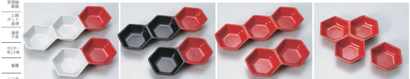
レンゲ スプーン 276-501-703 1,250円 紅白3品皿 (20.5×7.5×2.5) 276-503-703 1,250円 紅黒3品皿 (20.5×7.5×2.5) 276-505-703 1,200円 紅釉3品皿 (20.5×11.7×2.5) 276-507-703 1,350円 紅釉3品盛 (13.8×11.7×2.5) 灰皿 276-502-703 900円 紅白2品皿 (13.5×7.5×2.5) 276-504-703 900円 紅黒2品皿 (13.5×7.5×2.5) 276-506-703 850円 紅釉2品皿 (13.5×7.5×2.5) 276-508-703 550円 紅釉1品皿 (7.5×6.8×2.3)