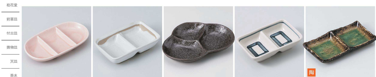
蓋物 276-201-263 1,050円 ピンク小判三品 (14×7.5×2) 276-202-793 1,020円 粉引ライン二品盛 (11×6.8) 276-203-153 1,100円 黒結晶松型仕切皿 (17.2×13.2×2.3) 276-204-793 840円 布目帯ライン二品薬味 (11×6.8×2.7) 276-205-263 820円 深海二品皿小 (14.5×7.7×2)