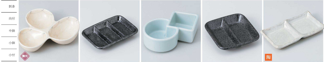
珍珠 276-101-703 2,880円 一珍カゴメ3品鉢 (19.5×17.8×3.8) 276-102-033 1,500円 黒結晶 三切薬味皿 (13×9×2) 276-103-263 1,400円 二連空色小付 (12×7.3×3.6) 276-104-033 1,300円 黒結晶 二切薬味皿 (9×2) 276-105-743 1,060円 真珠二品盛 (14.5×7.5×1.8)