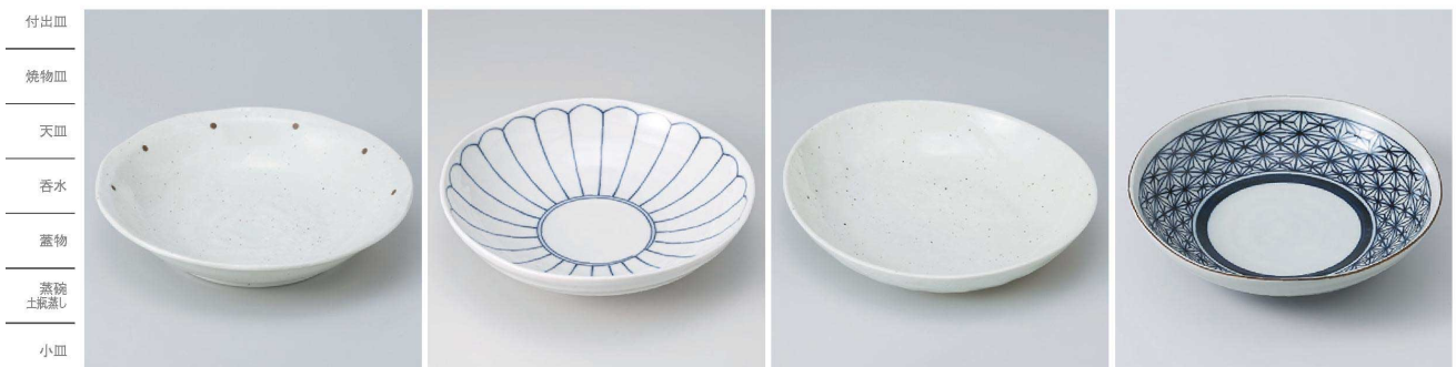
前菜皿 282-201-313 980円 粉引ドット7.0深皿 (21.5×4.5) 282-202-013 920円 菊線 六兵6.8深皿 (21×5.2) 282-203-413 720円 雪粉引 楕円21カレー皿 (21×20.3×4.6) 282-204-353 930円 古染小紋六兵6.8深皿 (21×5.2)