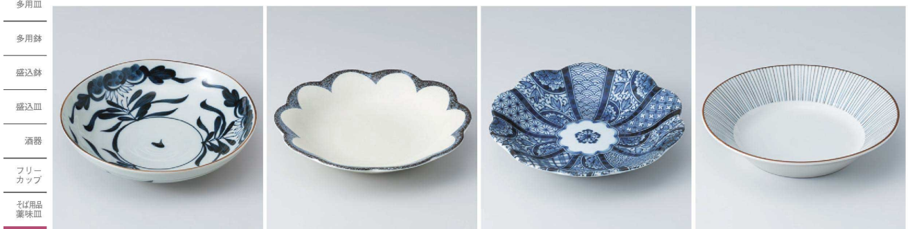
和皿 282-301-353 930円 古代草花六兵6.8深皿 (21×5.2) 282-302-263 900円 RINKA 紺 21.5cm深皿 (21.5×4) 282-303-333 880円 紺青花6.3深皿 (21.3×4) 282-304-403 800円 天平十草 7.0深皿 (21.5×5)