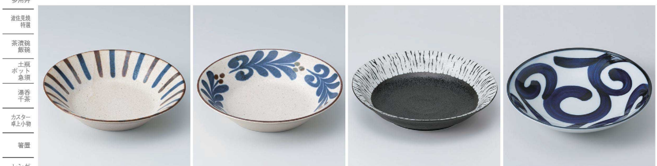
めん皿 282-401-403 800円 二色十草 7.0深皿 (21.5×5) 282-402-053 800円 ばいかじ7.0深皿 風 (21.5×4.6) 282-403-403 600円 黒潮7.0浅鉢 (21.5×4.5) 282-404-403 600円 鳴門唐草7.0浅鉢 (21.5×5)