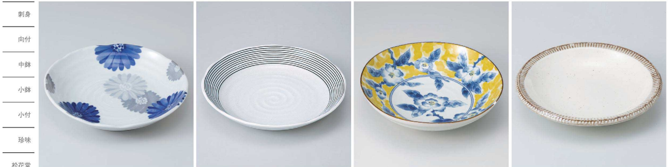
刺身 282-101-523 1,300円 菊花紋青 カレー皿 (21.8×4) 282-102-523 1,400円 ドリームライン白カレー皿 (21.8×4) 282-103-513 930円 黄彩花紋 六兵6.8深皿 (21×5.2) 282-104-253 960円 刷鍮粉引刷十草 8吋スープ (21.2×4.3)