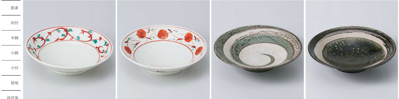
刺身 向付 中鉢 小鉢 小付 珍味 284-101-263 4,000円 錦唐草盛鉢(25×6.4) 284-102-263 4,000円 錦草花盛鉢(25×6.4) 284-103-083 2,850円 うず刷毛貫入8.0めん鉢うぐいす(24.5×7.5) 284-104-083 2,900円 黒織部8.0麵鉢(24.5×7.5)