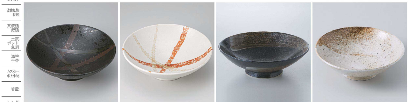
めん皿 井 多用井 液性見換 特選 茶漬碗 飯碗 土瓶 ポット 急須 湯呑 干茶 カスター 卓上小物 箸置 レンゲ スプーン 灰皿 284-401-633 1,850円 東雲(黒)8寸盛鉢(24.3×8) 284-402-633 1,850円 東雲(白)8寸盛鉢(24.3×8) 284-403-543 1,800円 明世荒刷毛8.0盛鉢(24.5×8) 284-404-243 1,800円 雪志野8.0盛鉢(24×8)