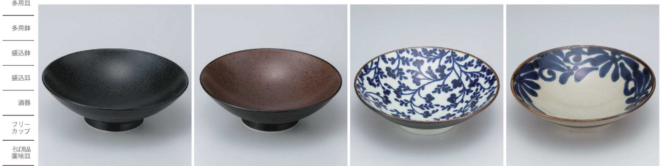
多用皿 多用鉢 盛込鉢 盛込皿 酒器 フリー カップ そば用品 薬味皿 284-301-263 2,050円 JベジBK24.5高台盛鉢(24.5×8) 284-302-263 2,050円 JベジBR24.5高台盛鉢(24.5×8) 284-303-613 2,200円 おふけ草花8.0めん鉢(24.5×7.5) 284-304-613 2,200円 琉球るり唐草8.0めん鉢(24.5×7.5)