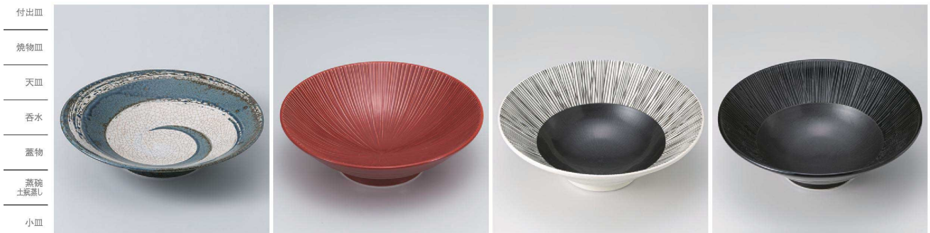
前菜皿 付出口 焼物皿 天皿 香水 蓋物 蒸碗 土氣蒸し 小皿 284-201-083 2,850円 うず刷毛貫入8.0めん鉢紺ねず(24.5×7.5) 284-202-613 2,400円 千段朱 千段8.0麵鉢(24.5×7.5) 284-203-633 2,100円 DN(WH) ボウル24(24×8) 284-204-633 2,100円 DN(BK) ボウル24(24×8)