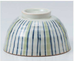
321-205-253 850円 二色十草平飯碗 (11.5×6.4)