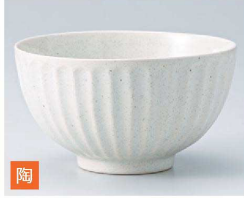
321-402-763 700円 菊柄茶碗 白 (12×6.6)