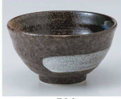
321-602-243 590円 刷毛巻手引飯碗 (11.8×6.2)