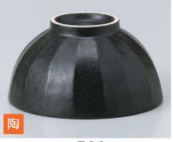
321-605-523 520円 色釉黒型入飯茶碗 (11.8×6.2)