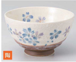
321-102-473 1,400円 平安桜茶碗(青) (11.5×6.8)