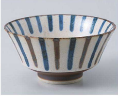
321-403-053 700円 ばいかじ茶碗 雨 (12.8×6.3)