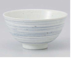
321-506-313 550円 濁粉引グレー中平 (11.2×5.5)