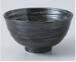
321-504-313 650円 黒濁丸碗(大) (12.5×6.6) 321-505-313 580円 黒濁丸碗(小) (11.4×6.3)