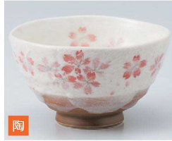
321-101-523 1,400円 平安桜茶碗 (11.5×6.8)