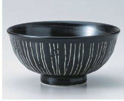
321-502-403 660円 彫十草(黒)茶碗 (11.6×5.6)