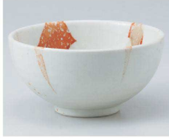
321-302-633 780円 東雲(白)4.2京碗 (13×6.4)