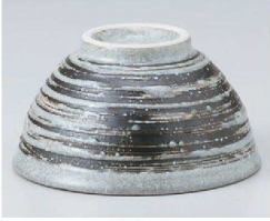
321-503-263 680円 縞織ライスボール (12.2×6.3)