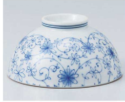
321-301-253 840円 芽吹き唐草軽量茶碗 (11.8×6)