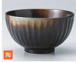
321-401-763 700円 菊柄茶碗 黒 (12×6.6)