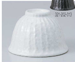
321-201-013 1,060円 白玉粉引しのぎ飯碗(11.5×7.7) 321-202-013 1,060円 黒御影しのぎ飯碗(11.5×7.7)