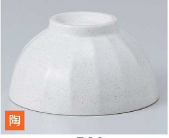
321-604-523 520円 色釉白型入飯茶碗 (11.8×6.2)