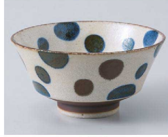
321-501-053 700円 ばいかじ茶碗 星 (12.8×6.3)