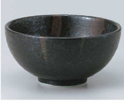
321-303-633 780円 東雲(黒)4.2京碗 (13×6.4)