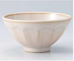
321-105-403 860円 クリーム 菊割大平 (12.8×7)