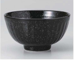
321-304-253 850円 御影削ぎ茶碗小 (11.5×6)