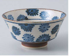
321-405-053 700円 ばいかじ茶碗 花 (12.8×6.3)