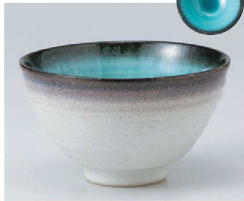
321-203-013 920円 均窯スカイ茶漬碗 (12.5×7.7)