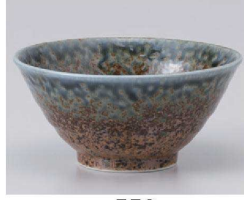
321-601-543 550円 砂地藍流し 飯碗 (13×6)