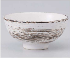
321-103-083 980円 錆粉引千段中平 (11.8×5.5)