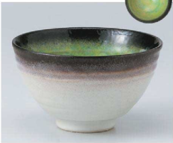
321-204-013 920円 均窯ヒワ茶漬碗 (12.5×7.7)