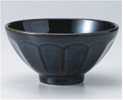
321-104-403 860円 窯変紺 菊割大平 (12.8×7)