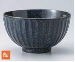
321-305-763 700円 菊柄茶碗 藍の雪 (12×6.6)