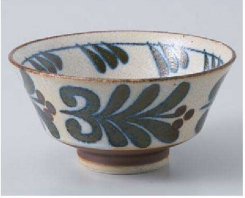
321-404-053 700円 ばいかじ茶碗 風 (12.8×6.3)