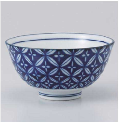
329-505-403 520円 藍染七宝茶碗(大) (12.5×6.5) 329-506-403 450円 藍染七宝茶碗(中) (11.3×5.5)