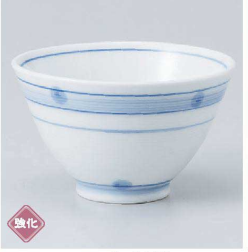
329-207-783 1,130円 ダミライン夏目型飯碗(大) (11.7×6.9) 329-208-783 1,060円 ダミライン夏目型飯碗(小) (10×6)