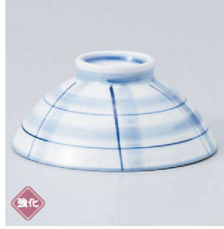
329-201-703 1,130円 格子毛料 (13.9×6.3) 329-202-703 860円 格子中平 (12×5.2)