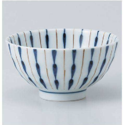
329-303-523 850円 しだれ十草 青 大平 (11.9×6.2) 329-304-523 700円 しだれ十草 青 中平 (11.3×5.9)