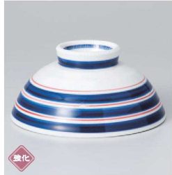
329-101-703 1,050円 うずまき毛料 紺 (13.8×6.3) 329-102-703 750円 うずまき中平 紺 (11.8×5.8)