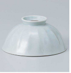
329-209-403 910円 軽量青白磁大平 (13×6.3) 329-210-403 790円 軽量青白磁中平 (12×5.5)