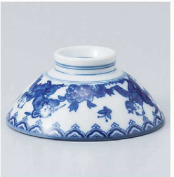
329-507-743 630円 厚口唐子大平 (13.2×5.7) 329-508-743 580円 厚口唐子中平 (12.1×5.3)