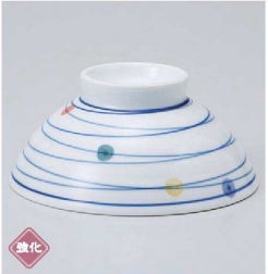
329-105-703 1,260円 四色水玉毛料 (13.6×6.2) 329-106-703 960円 四色水玉中平 (11.8×5.2)