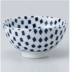
329-305-523 850円 市松小紋青大平 (11.8×6.4) 329-306-523 700円 市松小紋青中平 (11.2×6)