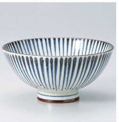
329-410-523 750円 藍十草青丸型大平 (13×6) 329-411-523 620円 藍十草青丸型茶碗 (11.5×5.5)