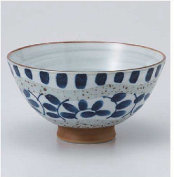
329-307-703 750円 帯タコ唐草毛料 (14.2×6.5) 329-308-703 650円 帯タコ唐草大平 (12.3×6.5) 329-309-703 530円 帯タコ唐草中平 (11.5×6)