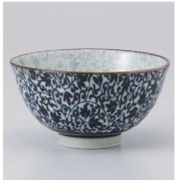
329-503-403 520円 益子唐草茶碗(大) (12.5×6.5) 329-504-403 450円 益子唐草茶碗(中) (11.3×5.5)