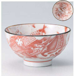
329-404-013 660円 ドラゴン 大平 赤 (12×6.5) 329-405-013 600円 ドラゴン 中平 赤 (11×6)