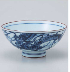
329-310-703 750円 青磁竜毛料 (14.5×6.5) 329-311-703 630円 青磁竜大平 (12.5×5.5)