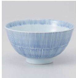
329-501-313 700円 京十草大平 (12.7×6.7) 329-502-313 550円 京十草中平 (11.2×5.5)