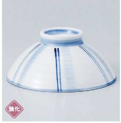
329-203-783 1,130円 親子十草毛料 (13.6×6.2) 329-204-783 860円 親子十草中平 (11.8×5.2)