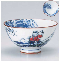
329-401-793 960円 波ネコ毛料 (14.2×6.3) 329-402-793 840円 波ネコ大平 (12.3×6.7) 329-403-793 720円 波ネコ中平 (11.5×6.2)