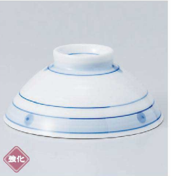
329-109-783 1,130円 ダミライン毛料 (13.6×6.3) 329-110-783 860円 ダミライン中平 (11.8×5.2)