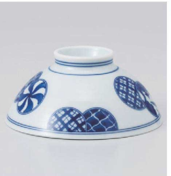
329-509-473 450円 六ベエ丸紋大平 (13×6) 329-510-473 350円 六ベエ丸紋中平 (11.8×5)