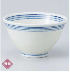
329-205-703 1,130円 アイボリーゴスライン(大)夏目型飯碗 (11.7×6.9) 329-206-703 1,060円 アイボリーゴスライン(小)夏目型飯碗 (10.4×6)