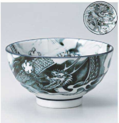
329-406-013 660円 ドラゴン 大平 黒 (12×6.5) 329-407-013 600円 ドラゴン 中平 黒 (11×6)