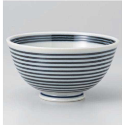
329-301-403 910円 せせらぎ 軽量 大平 (12.5×6.5) 329-302-403 790円 せせらぎ 軽量 中平 (11.3×6.4)