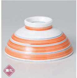
329-103-703 1,050円 うずまき毛料 オレンジ (13.8×6.3) 329-104-703 750円 うずまき中平 オレンジ (11.8×5.8)