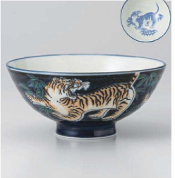
329-107-513 930円 虎毛料 (14.2×6.5) 329-108-513 810円 虎大平 (12.6×6.5)