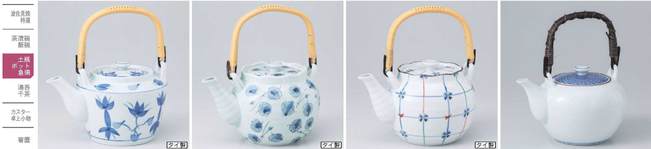
液体見換 特選 334-401-903 3,700円 古染花 角10号土瓶 (M) (16.5×15-2000cc) 334-403-903 3,600円 濃松葉8号土瓶 (M) (15×14-1650cc) 334-405-903 3,100円 錦花格子6号土瓶 (M) (13.5×13-1100cc) 334-406-903 6,250円 青海波紋5号土瓶 (12×10.5-800cc) 茶漬碗 飯碗 334-402-903 3,400円 古染花 角8号土瓶 (M) (15.5×13.6-1600cc) 334-404-903 3,000円 濃松葉6号土瓶 (M) (13.5×12.5-1100cc) 土瓶 ポット 急須 湯呑 干茶 カスター 卓上小物 箸置 レンジ スプーン 灰皿