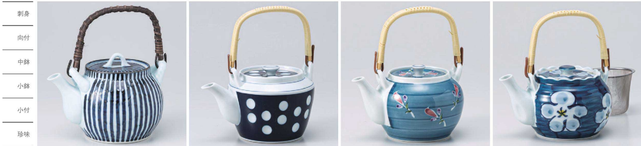
刺身 334-101-903 9,000円 鎌倉十草8号土瓶 (15×13.8-1200cc) 334-103-903 8,000円 水玉 10号土瓶 (17×14-1800cc) 334-106-903 8,000円 花娘 10号土瓶 (17×14-1800cc) 334-109-903 7,800円 コス白梅 10号土瓶 (16×12-1800cc) 向付 334-102-903 7,750円 鎌倉十草6号土瓶 (13.5×13-900cc) 334-104-903 6,500円 水玉 8号土瓶 (15×11.5-1400cc) 334-107-903 6,500円 花娘 8号土瓶 (15×11.5-1400cc) 334-110-903 7,000円 コス白梅 8号土瓶 (15×11-1400cc) 中鉢 334-105-903 5,500円 水玉 6号土瓶 (14×10.5-800cc) 334-108-903 5,000円 花娘 6号土瓶 (14×10.5-800cc) 334-111-903 5,800円 コス白梅 6号土瓶 (13.5×10-1000cc) 小鉢 小付 珍珠