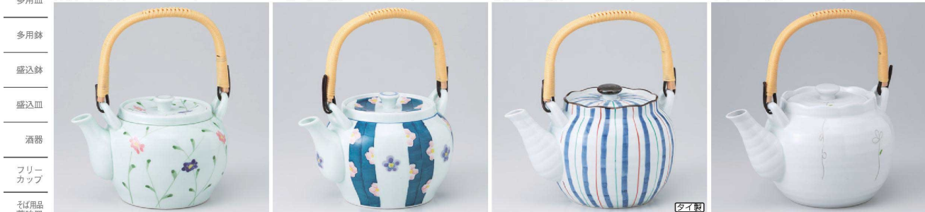
小皿 334-301-903 6,800円 小町草10号土瓶 (16×13.7-1800cc) 334-304-903 7,000円 花びょうぶ10号土瓶 (16×13.7-1800cc) 334-307-903 4,500円 古代十草8号土瓶 (M) (15.2×14.5-1650cc) 334-309-903 4,000円 銀のつばみ8号土瓶 (M) (15.3×14.4-1650cc) 和皿 334-302-903 6,000円 小町草8号土瓶 (15×12.5-1400cc) 334-305-903 6,200円 花びょうぶ8号土瓶 (14.5×13.5-1400cc) 334-308-903 3,100円 古代十草6号土瓶 (M) (14×12.8-1100cc) 334-310-903 3,000円 銀のつばみ6号土瓶 (M) (13.5×13-1100cc) 多用皿 334-303-903 4,600円 小町草6号土瓶 (13.5×11-1000cc) 334-306-903 4,800円 花びょうぶ6号土瓶 (12.8×11.5-1000cc) 多用鉢 盛込鉢 盛込皿 酒器 フリー カップ そば用品 薬味皿