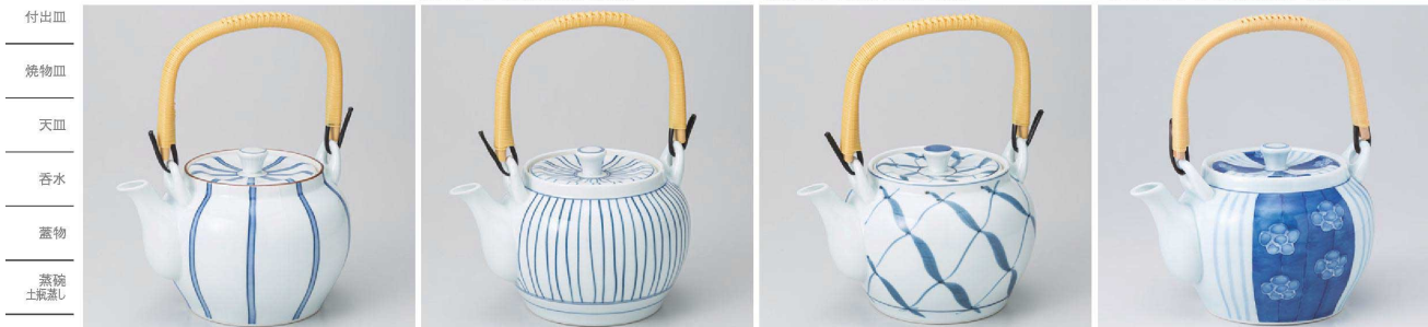
前菜皿 334-201-903 7,000円 線濃10号土瓶 (16×13.7-1800cc) 334-204-903 7,000円 立枠10号土瓶 (16×13.7-1800cc) 334-207-903 7,000円 京網10号土瓶 (16×13.7-1800cc) 334-210-903 7,000円 京染10号土瓶 (16×13.7-1800cc) 付出口 334-202-903 6,200円 線濃8号土瓶 (14.5×12.5-1400cc) 334-205-903 6,200円 立枠8号土瓶 (14.5×12.5-1400cc) 334-208-903 6,200円 京網8号土瓶 (14.5×12.5-1400cc) 334-211-903 6,200円 京染8号土瓶 (15×12.5-1400cc) 焼物皿 334-203-903 4,800円 線濃6号土瓶 (12.8×11.5-1000cc) 334-206-903 4,800円 立枠6号土瓶 (12.8×11.5-1000cc) 334-209-903 4,800円 京網6号土瓶 (12.8×11.5-1000cc) 334-212-903 4,800円 京染6号土瓶 (13.5×11-1000cc) 天皿 香水 蓋物 蒸碗 土瓶蒸し