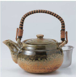
339-304-013 4,380円 グリーン伊良保5号土瓶(U・茶コシ付) (19×12-750cc)