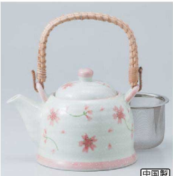
339-504-413 2,300円 土瓶 さくらさくら (16×12.5×11.5-600cc)