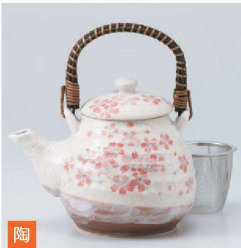
339-303-523 4,800円 平安桜土瓶Uアミ付 (11.5×14-770cc)