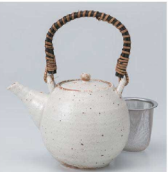
339-405-603 4,900円 サビ志野 土瓶(大) (16×10.3×11.3-530cc) 339-406-603 4,800円 サビ志野 土瓶(小) (13.5×9.4×10.1-370cc)