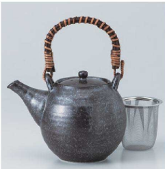
339-403-523 5,100円 漆黒土瓶(アミ付)大 (16×10.3×11.3-530cc)