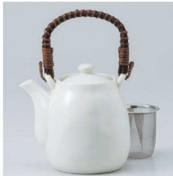
339-502-353 3,650円 セミマット 土瓶(カゴアミ付) (9×12-400cc)