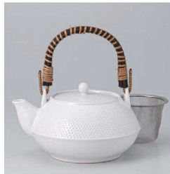
339-201-253 8,100円 あられ土瓶 白 (17.1×14.7×9.5-800cc)