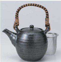
339-404-523 5,000円 漆黒土瓶(小) (13.5×19.4×10.1-350cc)