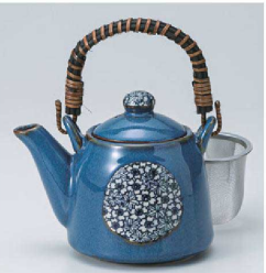
339-505-203 2,900円 スリム土瓶春秋 (10.5×12.3-480cc)