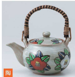
339-301-513 3,400円 染錦椿(中)土瓶 (16.5×10.5-600cc)