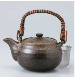
339-206-013 4,380円 金彩5号土瓶(U・茶コシ付) (19×12-750cc)