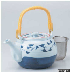
339-302-203 4,000円 コス巻唐草土瓶6.0 (20.5×11-1050cc)