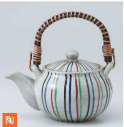
339-305-513 3,400円 十草中土瓶 (16.5×10.5-600cc)