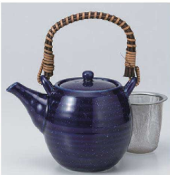
339-203-523 5,100円 夜空 土瓶(アミ付)大 (16×10.3×11.3-530cc) 339-204-523 5,000円 夜空 土瓶(小) (13.5×19.4×10.1-350cc)