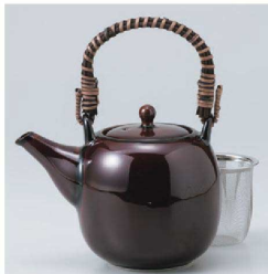
339-202-523 6,300円 うるし釉土瓶Uアミ付 (10.5×11.5-520cc)