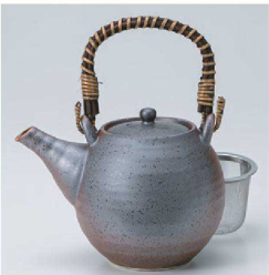
339-205-523 5,200円 黒信楽土瓶アミ付 (16×10.3×11.3-530cc)