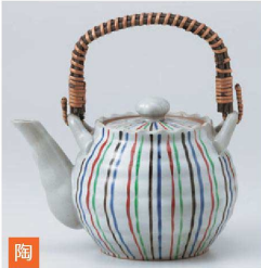
339-103-513 5,200円 十草6号土瓶 (19×12.5-1000cc)