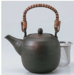
339-402-153 6,000円 備前丸土瓶(カゴアミ付) (14.3×9.8×11.5-520cc)