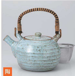
339-102-543 8,500円 唐津7号土瓶 (15×11.8-1250cc)