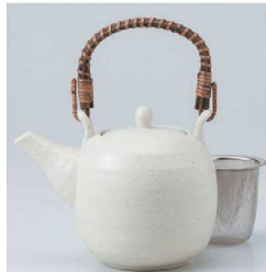
339-401-153 6,000円 粉引丸土瓶(カゴアミ付) (14.3×9.8×11.5-520cc)