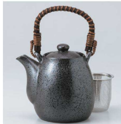
339-501-353 3,650円 黒結晶 土瓶(カゴアミ付) (9×12-400cc)