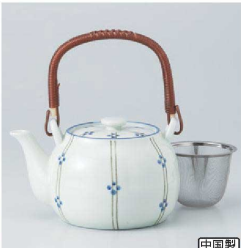
339-503-523 3,450円 十草丸紋青5号土瓶 (13×9.8-520cc)