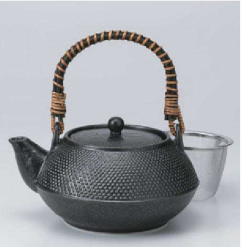
339-105-253 8,100円 あられ土瓶鉄黒 (17.1×14.7×9.5-800cc)