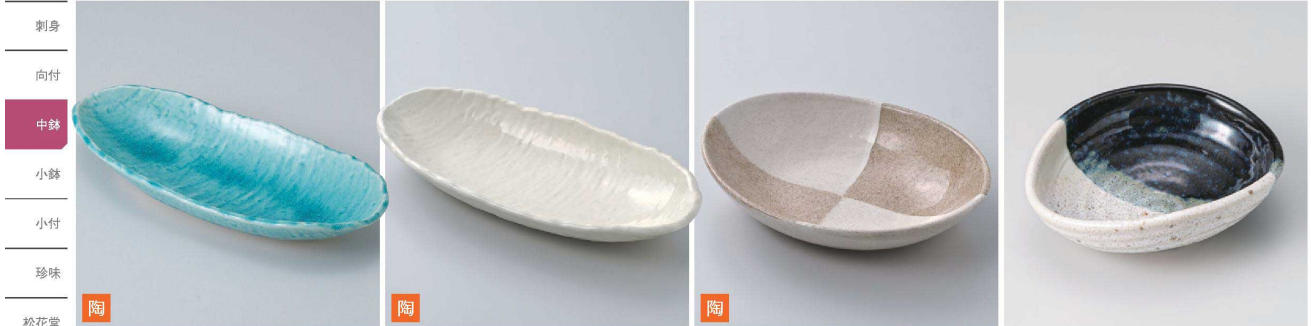
刺身 向付 中鉢 小鉢 小付 珍味 陶 松花堂 前菜皿 34-101-783 1,400円 トルコ舟型小鉢 (22×10×3.5) 34-102-783 1,400円 粉引舟型小鉢 (22×10×3.5) 34-103-743 1,350円 唐津化粧楕円フルーツ鉢 (16.8×12.4×3.3) 付出血 34-104-263 1,300円 塗り分け黒たまご小鉢 (14.4×12.2×5.2)