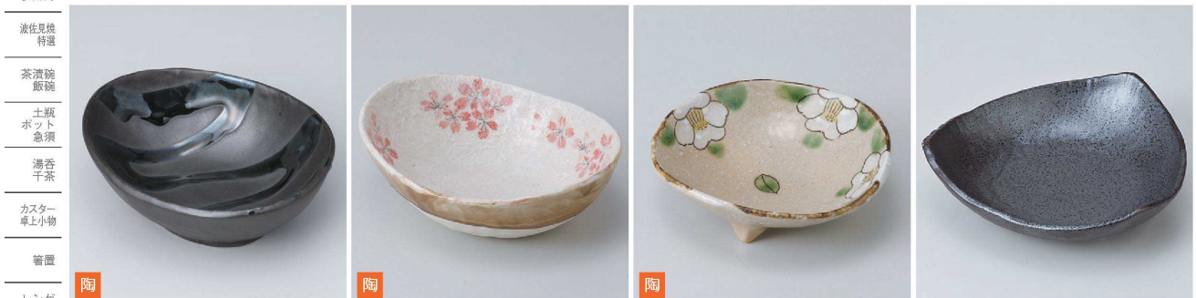
レンゲ スプーン 灰皿 34-401-413 1,200円 ひるがの 三角 中鉢 (15.4×13×5) 34-402-523 1,200円 平安桜楕円中鉢 (16×12.5×5.5) 34-403-523 1,200円 織部楕三ツ足小鉢 (14×13.5×4.2) 34-404-783 1,200円 黒釉三角鉢 (17.5×17×4.8)