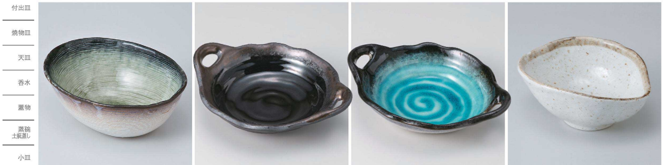
焼物皿 天皿 香水 蓋物 蒸碗 土氣蒸し 小皿 和皿 34-201-013 1,380円 均霰グリーンストライプ楕円鉢 (16.5×13.3×6.5) 34-202-253 1,300円 金彩天目両手付丸鉢小 (18.5×14.5×4.3) 34-203-253 1,300円 霏変スカイ両手付丸鉢小 (18.5×14.5×4.3) 多用皿 34-204-353 1,280円 白唐津変型小鉢 (15×11.6×6.3)