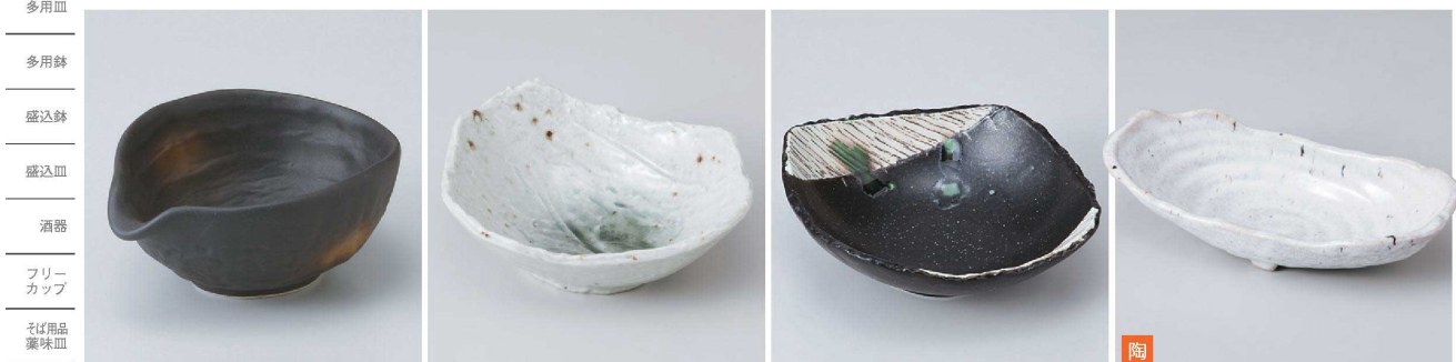
めん皿 井 多用井 波仕見換 特選 茶漬碗 飯碗 土瓶 ポット 急須 湯呑 干茶 カスター 卓上小物 箸置 陶 めん皿 34-301-513 1,050円 美濃備前新片口4.0鉢 (14.2×11.5×6) 34-302-353 1,250円 湖畔小鉢 (15×12×5.5) 34-303-353 1,250円 黒織部角楕目型取鉢 (16.5×14×5) 井 34-304-603 1,220円 白ウノフ 舟型長鉢(大) (19.7×8×5.2)