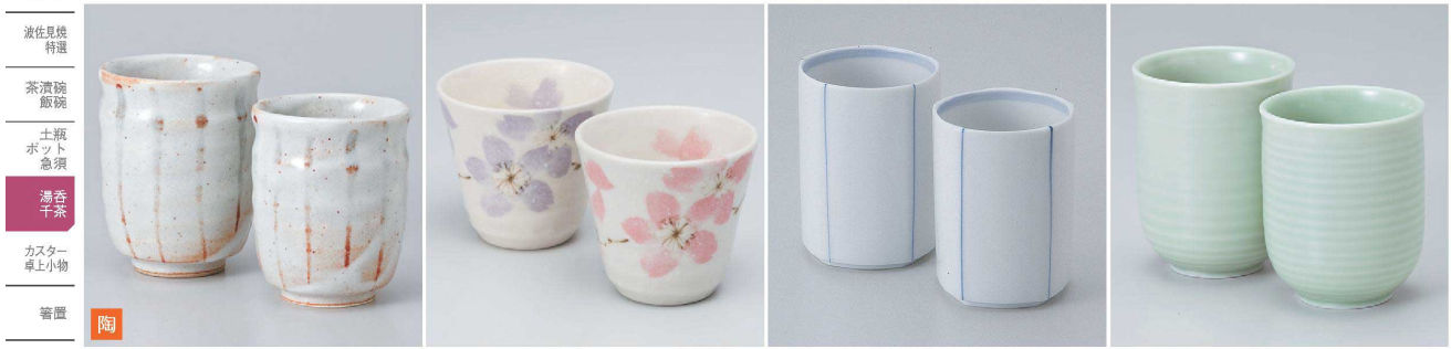
陶 志野十草湯呑(大) (7×9×180cc) 354-401-523 680円 陶 みやま桜紫 ゆのみ (8.5×7.5×200cc) 354-403-573 710円 陶 白磁五角トクサ湯呑(大) (6.2×8.4×190cc) 354-405-573 650円 陶 ヒワ長湯呑(大) (7.2×9×240cc) 354-407-063 500円 カスター 卓上小物 志野十草湯呑(小) (6.5×8×150cc) 354-402-523 650円 みやま桜ピンク ゆのみ (8.5×7.5×200cc) 354-404-573 710円 白磁五角トクサ湯呑(小) (6×8×160cc) 354-406-573 630円 ヒワ長湯呑(小) (7×8.4×190cc) 354-408-063 470円