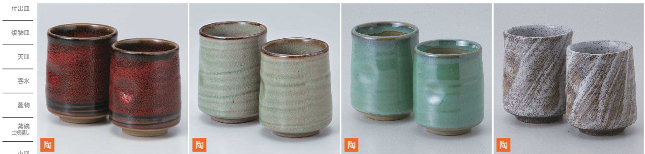
陶 赤柚子湯呑(大) (7×9×250cc) 354-201-053 940円 陶 波草ペコ湯呑(大) (6.6×8.9×220cc) 354-203-163 690円 陶 均窯長湯呑(大) (7×9×250cc) 354-205-053 720円 陶 さざ波湯呑(大) (7×9×210cc) 354-207-573 800円 和皿 赤柚子湯呑(小) (6.5×8.5×190cc) 354-202-053 910円 波草ペコ湯呑(小) (6.3×8.4×180cc) 354-204-163 640円 均窯長湯呑(小) (6.5×8.5×190cc) 354-206-053 690円 さざ波湯呑(小) (6.3×8.5×170cc) 354-208-573 710円