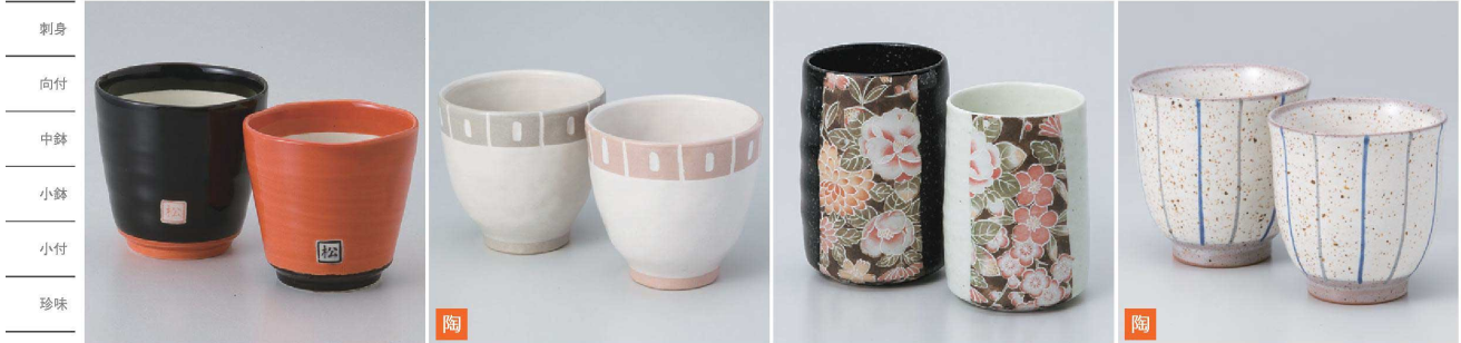
松花堂 黒雅湯呑(大) (8.5×8.3×280cc) 354-101-473 2,300円 陶 測飾り湯呑(グレー) (8.1×7.7×195cc) 354-103-743 1,380円 黒友禅 組湯呑(大) (6.6×9.3×195cc) 354-105-153 850円 陶 二色十草青 湯呑(大) (8×8×210cc) 354-107-603 830円 前菜皿 赤雅湯呑(中) (8.2×7.7×240cc) 354-102-473 2,300円 測飾り湯呑(ピンク) (8.1×7.7×195cc) 354-104-743 1,380円 白友禅 組湯呑(小) (6.2×8.5×145cc) 354-106-153 800円 二色十草青 湯呑(小) (7.3×7.6×180cc) 354-108-603 800円