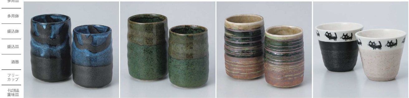
陶 ローヌキ長湯呑(大) (6.2×9.5×210cc) 354-301-243 750円 陶 わさび染長湯呑(大) (6.2×9.5×210cc) 354-303-243 750円 陶 ローヌズ長湯呑(大) (6.2×9.5×210cc) 354-305-243 750円 陶 黒猫 白フリーカップ (8.3×7.5×200cc) 354-307-613 780円 めん皿 ローヌキ長湯呑(小) (5.7×8.5×180cc) 354-302-243 730円 わさび染長湯呑(小) (5.7×8.5×180cc) 354-304-243 730円 ローヌズ長湯呑(小) (5.7×8.5×180cc) 354-306-243 730円 黒猫 白フリーカップ (8.3×7.5×200cc) 354-308-613 780円