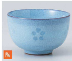
367-401-543 580円 均窯梅紋千茶 (8.5×5.4-180cc)