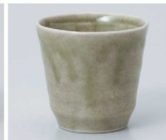
367-505-253 860円 もえぎ小湯呑 (7.6×7.1-190cc)