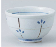
367-101-743 790円 芽生え千茶(青) (8.9×5.2-180cc)