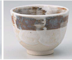
367-305-743 630円 ねずみ志野千茶 (8×8-150cc)