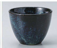
367-602-313 880円 紺結晶 煎茶 (7.8×6-150cc)