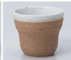
367-504-163 420円 木肌白湯呑 (7.8×6.8-160cc)