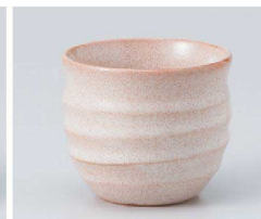
367-605-573 470円 ゆず志野小湯呑 (6.8×5.8-120cc)