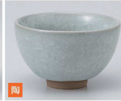
367-104-153 760円 白貫入丸煎茶 (9.2×5.7-170cc)