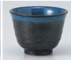
367-403-163 480円 ルリ測流反煎茶 (8.2×5.8-120cc)