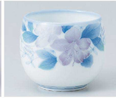
367-303-263 600円 白磁花の香玉湯呑 (7.5×6-175cc)