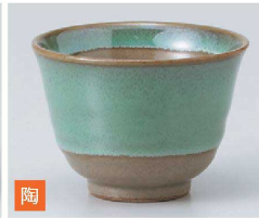
367-402-473 580円 均窯反千茶 (8.3×6-120cc)