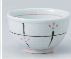
367-102-743 790円 芽生え千茶(赤) (8.9×5.2-180cc)