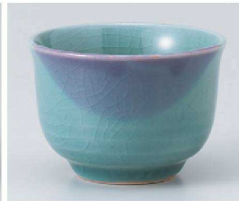
367-202-013 690円 ヒスイ貫入千茶 (8.5×6-175cc)