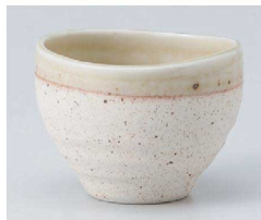
367-501-263 440円 ロク口目ヒワ丸煎茶 (7.8×5.7-150cc)