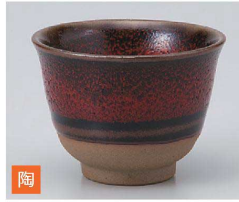
367-301-053 600円 赤柚子千茶 (8×5.8-140cc)