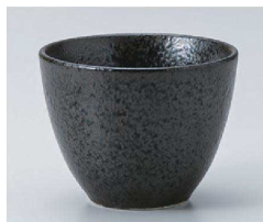
367-601-313 880円 黒結晶 煎茶 (7.8×6-150cc)