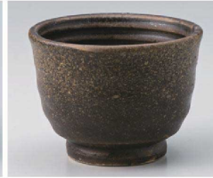
367-103-013 770円 金彩 煎茶大 (8.5×6.5-230cc)