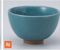
367-105-153 760円 トルコ貫入丸煎茶 (9.2×5.7-170cc)