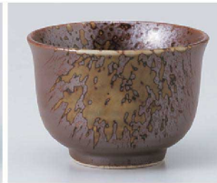
367-203-013 690円 南蛮千茶 (8.5×6-175cc)