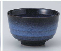
367-204-403 600円 オーロラ六兵衛 煎茶 (8.8×5.5-190cc)