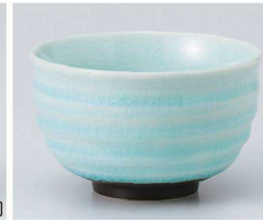
367-405-573 580円 青地貫入煎茶 (8.5×5.3-150cc)