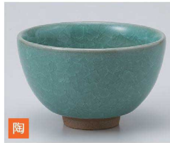
367-201-153 760円 ヒワ貫入丸煎茶 (9.2×5.7-170cc)