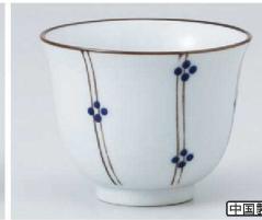
367-404-523 480円 十草丸紋青 煎茶 (8×6.6-160cc)