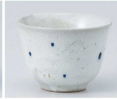
367-304-053 680円 粉引水玉千茶 (8×5.8-140cc)