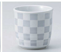
367-603-163 460円 市松白反型湯呑 (7×6.8-140cc)