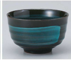
367-302-403 600円 エメラルド六兵衛 煎茶 (8.8×5.5-190cc)