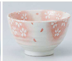
367-503-403 410円 花晴千茶 (9.2×5.7-160cc)