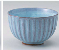
367-205-403 600円 オーロラ十章 煎茶 (8.8×5.5-200cc)