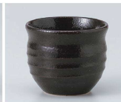
367-604-573 470円 ゆず黒小湯呑 (6.8×5.8-120cc)