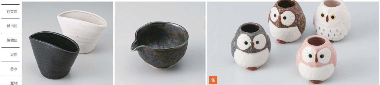
374-201-523 1,000円 黒しゃもじ立 (12.6×5.8×8.8) 374-202-523 1,000円 白しゃもじ立 (12.6×5.8×8.8) 374-203-153 700円 虹彩片口ミニドレッシング (8.5×7.2×4.5-190cc) 374-204-473 750円 ふくろう楊枝立(青) (5×5) 374-205-473 750円 ふくろう楊枝立(茶) (5×5) 374-206-473 750円 ふくろう楊枝立(ピンク) (5×5) 374-207-473 750円 ふくろう楊枝立(白) (5×5)