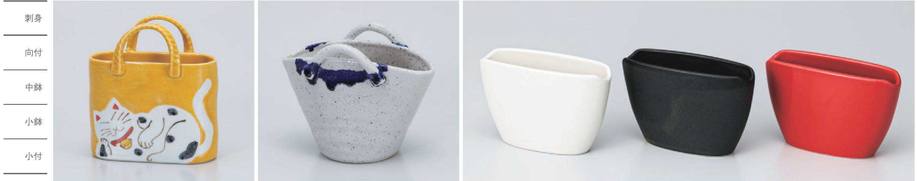
374-101-903 2,750円 招福ネコキャリーバック (11.5×6×12.2) 松花堂 374-102-153 1,000円 青流しバック型しゃもじ入 (13×7.5×10) 374-103-633 970円 MD cafe (MW) シャモジホルダー (11×4.1×7) 374-104-633 970円 MD cafe (BK) シャモジホルダー (11×4.1×7) 374-105-633 970円 MD cafe (RD) シャモジホルダー (11×4.1×7)