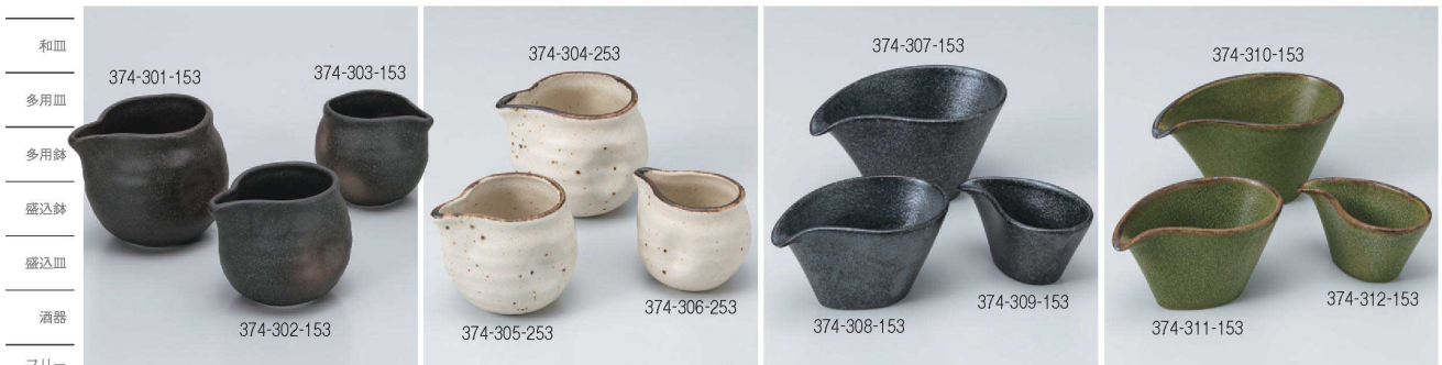
374-301-153 2,300円 備前風 汁次 小 (9.5×7.5×7.5-270cc) 374-302-153 2,000円 備前風 汁次 ミニ (8.5×7×7-180cc) 374-303-153 1,750円 備前風 汁次 マイクロ (7.7×6.5×6.2-150cc) 374-304-253 2,850円 ソース&ドレッシングシロン大 (9.5×7.5×7.5-250cc) 374-305-253 2,350円 ソース&ドレッシングシロン小 (8.5×7×7-200cc) 374-306-253 2,100円 ソース&ドレッシングシロンミニ (7.5×6×6-130cc) 374-307-153 1,700円 片口汁次(大) 銀黒 (12×7×6-150cc) 374-308-153 1,400円 片口汁次(小) 銀黒 (10×6×5-100cc) 374-309-153 1,200円 30ピッチャー 黒銀彩 (8.2×4.6×4.4-39cc) 374-310-153 1,700円 片口汁次(大) オリーブ (12×7×6-150cc) 374-311-153 1,400円 片口汁次(小) オリーブ (10×6×5-100cc) 374-312-153 1,200円 30ピッチャー オリーブ (8.2×4.6×4.4-39cc)