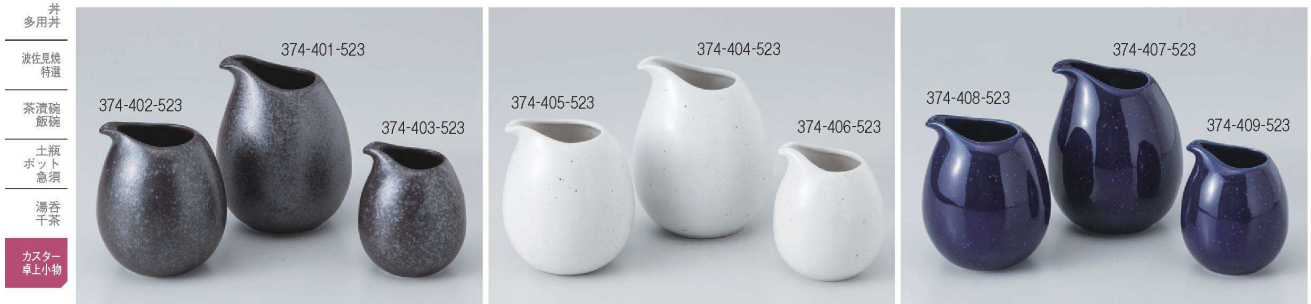
374-401-523 1,700円 銀黒ドレッシング 大 (8.3×10.2-300cc) 374-402-523 1,430円 銀黒ドレッシング 中 (7.5×8.7-210cc) 374-403-523 1,380円 銀黒ドレッシング 小 (6×7.4-110cc) 374-404-523 1,700円 白備前ドレッシング 大 (8.3×10.2-300cc) 374-405-523 1,430円 白備前ドレッシング 中 (7.5×8.7-210cc) 374-406-523 1,380円 白備前ドレッシング 小 (6×7.4-110cc) 374-407-523 1,750円 夜空ドレッシング 大 (8.3×10.2-300cc) 374-408-523 1,500円 夜空ドレッシング 中 (7.5×8.7-210cc) 374-409-523 1,380円 夜空ドレッシング 小 (6×7.4-110cc)