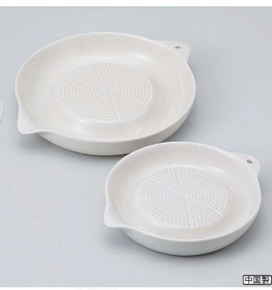
中国製 375-404-513 1,380円 おろし皿L (1950-048) (21.3×17.8×3.1) 375-405-513 980円 おろし皿M (1943-038) (16.7×14.2×2.8)