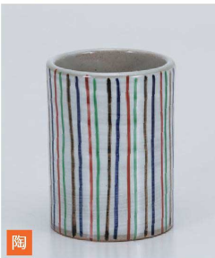
陶 375-302-473 2,300円 錦十草管立 (8×10.5)