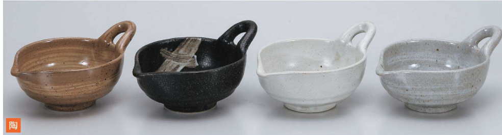
陶 375-101-513 1,000円 黄瀬戸オリベ納豆鉢 (16.5×12.5×5.8) 375-102-603 1,000円 天正黒納豆鉢 (16.5×12.3×8.5) 375-103-603 1,000円 粉引刷毛納豆鉢 (16.5×12.3×8.5) 375-104-603 1,000円 粉引青釉納豆鉢 (16.5×12.5×8.3)