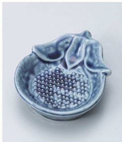
375-305-603 300円 紺イラボなす型ミニおろし器 (8.2×6.3×2)