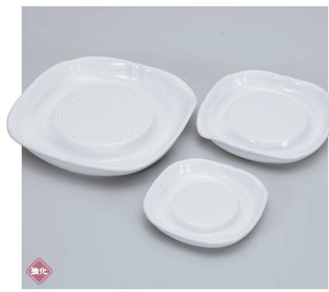
強化 375-401-703 4,290円 ノンスリップおろし器大(白) (17.3×17.3×3.1) 375-402-703 2,610円 ノンスリップおろし器中(白) (13.5×13.5×2.2) 375-403-703 1,630円 ノンスリップおろし器小(白) (10.1×10.1×1.9)