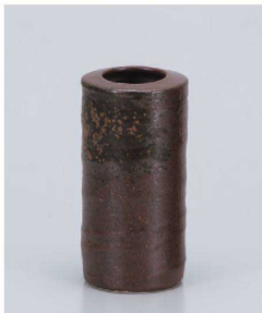
375-304-523 630円 備前丸串入 (4.8×10)