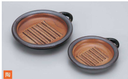
陶 375-201-163 1,200円 天目鑄3.8手付オロシ皿 (12.5×11×2.5) 375-202-163 980円 天目鑄ミニオロシ皿 (10×8.8×1.9)