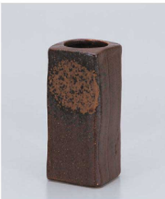
375-303-523 630円 備前角串入 (4.8×4.8×10)