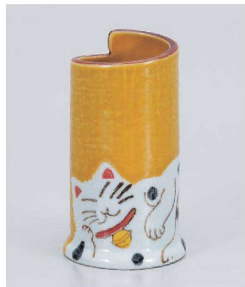
375-301-903 2,250円 招福ネコ管立 (5.7×12)