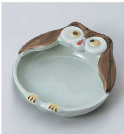
375-206-903 1,300円 ふくろうお玉立 (12×10.5×4.5)