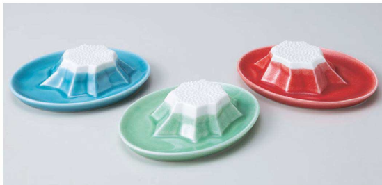
375-203-513 2,200円 富士山ブルーオロシ皿 (11.2×8.6×2.5) 375-204-513 2,200円 富士山グリーンオロシ皿 (11.2×8.6×2.5) 375-205-513 2,200円 富士山レッドオロシ皿 (11.2×8.6×2.5)