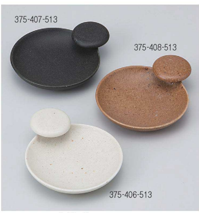
375-407-513 375-406-513 375-406-513 1,950円 粉引風味見お玉たて (12.5×10.3×3.1) 375-407-513 1,950円 黒伊賀味見お玉たて (12.5×10.3×3.1) 375-408-513 1,950円 茶伊賀味見お玉たて (12.5×10.3×3.1)