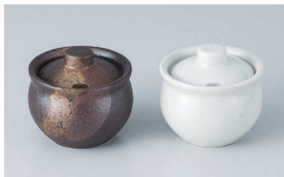
377-501-153 600円 備前薬味壺(小) (7.2×6.8×110cc)