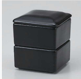
377-103-473 2,600円 黒四角二段蓋物 (7×8)