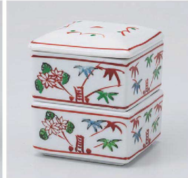
377-105-473 4,200円 赤絵手描菊芭蕉蓋付二段重 (7×3.8)