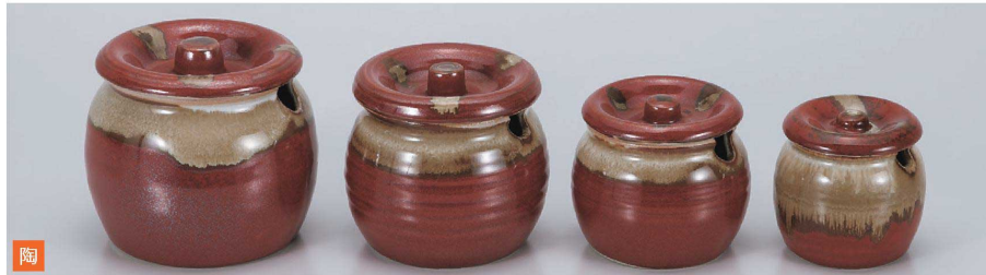
377-204-473 3,100円 桔梗二段蓋物(小) (7×6.2)