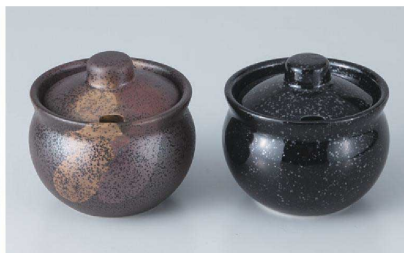
377-503-153 650円 備前薬味壺(大) (8×7.8×160cc)