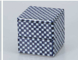
377-305-153 4,200円 江戸市松ミ二段重 (9×9×9.2) 377-306-153 2,800円 江戸市松ミ一段重 (9×9×5)