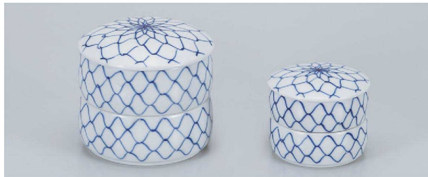
377-201-473 4,300円 アミ二段蓋物(中) (9.5×9)