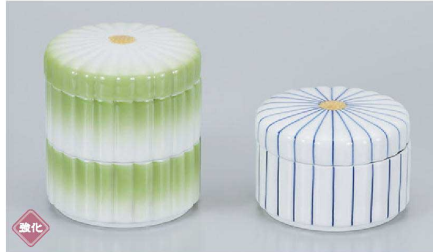
377-101-783 4,000円 新緑菊型蓋物二段 (8.5×9)