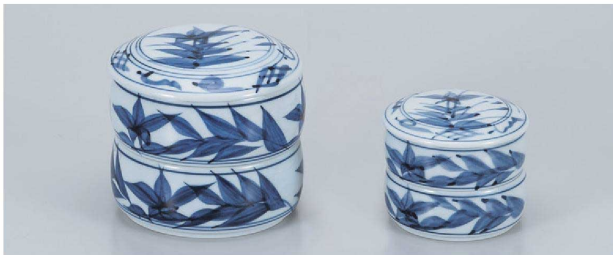
377-203-473 4,150円 桔梗二段蓋物(中) (9.5×9)