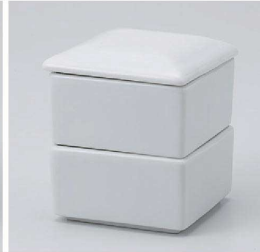
377-104-473 2,200円 白四角二段蓋物 (7×8)