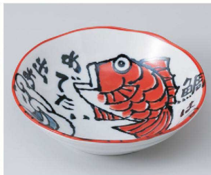
39-402-013 550円 めで鯛 5.0浅鉢 赤 (16.5×4.5)