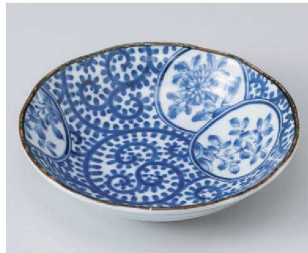
39-301-253 680円 丸紋唐草 5.5浅鉢 (16.5×4)