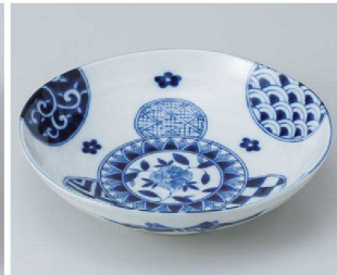
39-304-413 580円 藍丸紋六兵5.5浅鉢 (17.8×4.8)