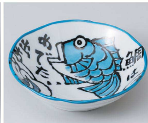
39-403-013 550円 めで鯛 5.0浅鉢 青 (16.5×4.5)