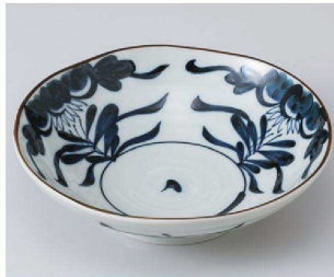
39-302-353 580円 古代草花六兵5.5浅鉢 (17×4.9)