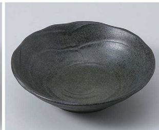
39-504-333 650円 山科5.0鉢 (16.3×4.5)