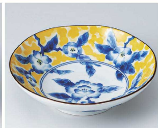
39-204-513 600円 黄彩花紋菊形六兵5.5浅鉢 (17×4.9)