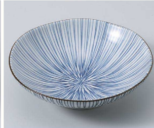
39-103-403 600円 光琳 六兵5.5浅鉢 (17×4.8)