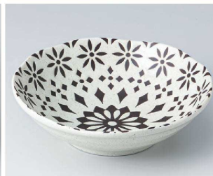
39-203-013 610円 ザフラ 粉引白マツト 5.0浅井 (16.5×4.7)