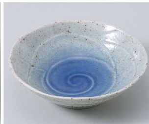
39-503-333 650円 花湖水5.0鉢 (16.3×4.5)