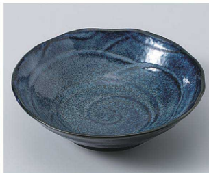
39-502-333 650円 紺花5.0鉢 (16.3×4.5)