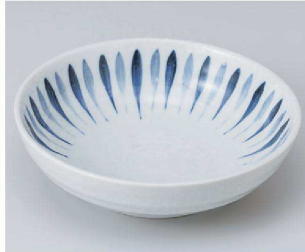
39-102-513 660円 夢十草4.5ボール (15.1×4.8)