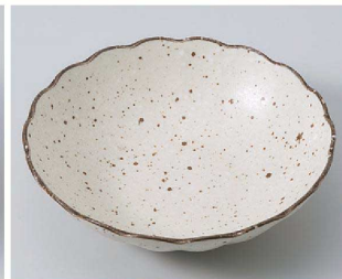
39-404-603 550円 白化粧 菊型5.5浅鉢 (16.9×4.9)