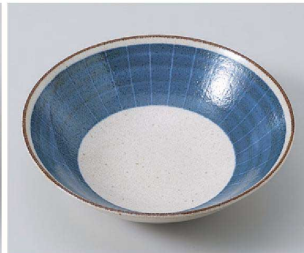
39-303-313 580円 バウム 14cmポウル (14.2×4.7)