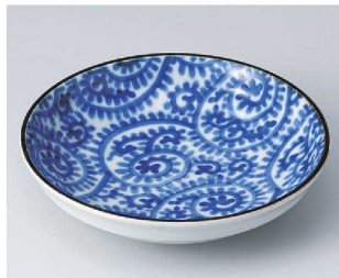
39-501-153 500円 タコ唐草六兵衛5.0鉢 (16.2×4)