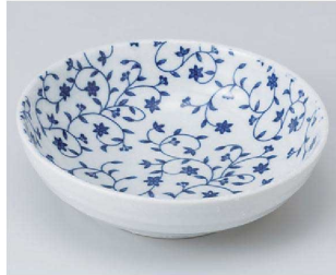
39-101-513 660円 花唐草4.5ボール (15.1×4.8)