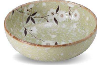
397-7-543 1,000円 5.5ボール(17.3×6)