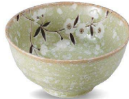
397-12-543 1,100円 5.5多用丼(16.8×8.8)