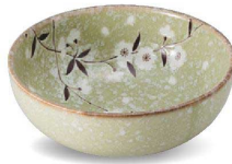
397-8-543 1,500円 6.5ボール(19.7×7.2)