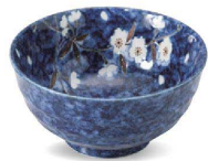
397-63-543 1,100円 5.5多用丼(16.8×8.8)