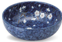
397-58-543 1,500円 6.5ボール(19.7×7.2)