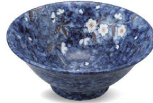
397-59-543 900円 6.5そば丼(19.5×8)