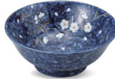
397-60-543 1,500円 6.8高台ラーメン丼(21×8.5・1300cc)