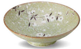
397-10-543 1,700円 8.0盛鉢(24.5×8)