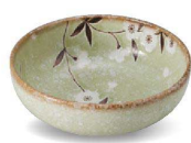
397-6-543 750円 4.8ボール(15.3×5.5)