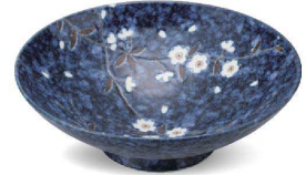
397-61-543 1,700円 8.0盛鉢(24.5×8)