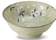
397-9-543 1,500円 6.8高台ラーメン丼(21×8.5・1300cc)