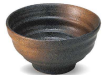
399-17-413 2,750円 ろくろ目井 (17.7×9.2)