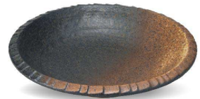
399-12-413 3,300円 8.0麵鉢 (25×5)