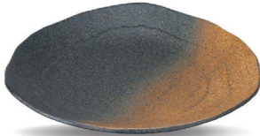
399-4-413 3,300円 三角9.0皿 (26.5×3.8)