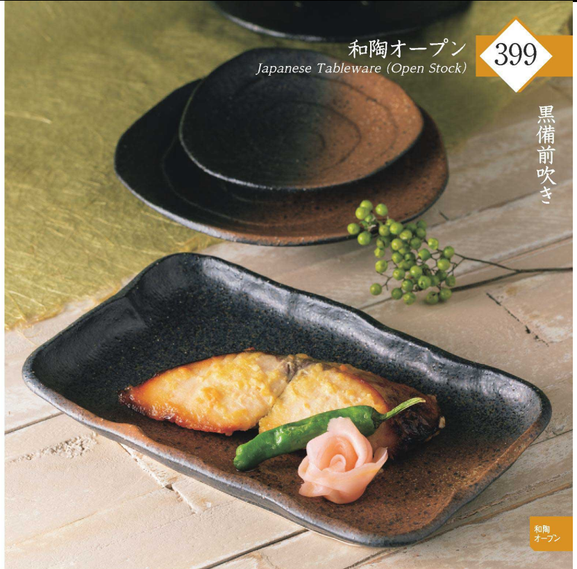
399-19-413 1,100円 六兵衛めし碗(大) (12.2×6.6-400cc)