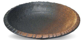
399-12-413 3,300円 8.0麵鉢 (25×5)