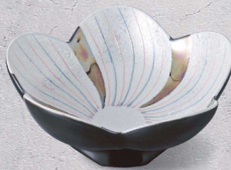
強化 41-402-053 4,800円 黒釉二色一珍ラスター花型向付(14.3×14.3×5.8)