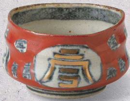
陶 41-101-303 4,000円 文字入赤濃小鉢(10.5×6)