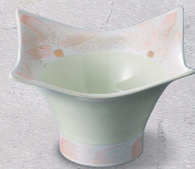
強化 41-403-053 3,500円 ピンクラスター四方高台小鉢(11×11×8)