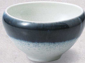
41-102-513 3,550円 アーバンネービー深ボウル(S)(11×6.3)