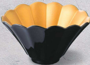
強化 41-301-053 3,200円 黒釉菊型3.8小鉢ゴールド(11×9.5×6.2)