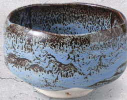
陶 41-202-303 2,600円 アメ釉ブルー抹茶鉢(11×7)