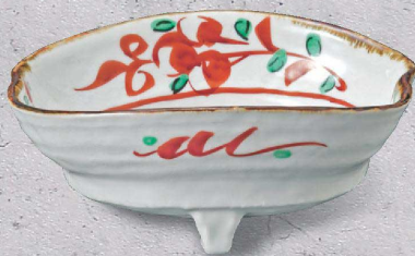
強化 41-401-743 3,810円 赤絵三ツ足向付(14×12.2×6)