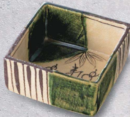
陶 41-302-783 4,000円 織部つる花角小鉢(10×10×4.8)