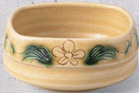
陶 41-201-053 3,000円 黄瀬戸角小鉢(11.7×11×5)