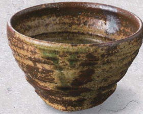
陶 41-103-253 3,600円 黄灰釉深小鉢(11.5×7)