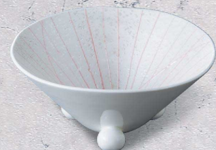
強化 41-303-053 3,200円 ピンクー珍三つ足小鉢(11.5×5.5)