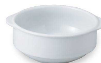
514-505-083 720円 白スタックスープカップ M (14.3×12.2×5.7-450cc)