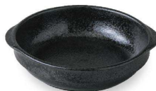
514-503-083 900円 黒スタックグラタン M (15.9×14.5×4)