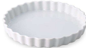
514-105-033 2,300円 白丸型8時パイ皿 (20.5×3)