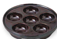
514-604-033 2,500円 アメ釉エスカルゴ (15.8×2.6)