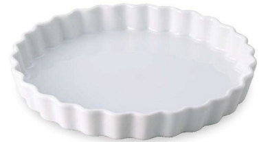
514-107-033 3,400円 白丸型10時パイ皿 (26×3.3)