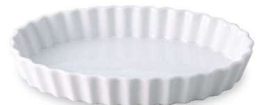
514-204-033 2,900円 白10時小判パイ皿 (26×17×3.8)