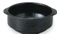
514-507-083 830円 黒スタックスープカップ M (14.3×12.2×5.8-450cc)