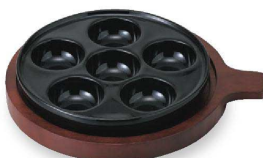
514-601-033 2,500円 ブラックエスカルゴ(15.8×2.6) 514-602-033 2,900円 木台 L(21.5×18.5×2.2)