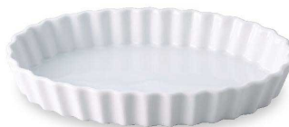
514-203-033 2,300円 白9時小判パイ皿 (23.5×15×3.5)