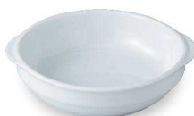
514-501-083 780円 白スタックグラタン M (15.9×14.5×4)