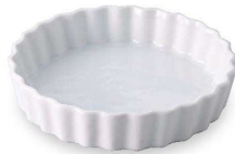
514-103-033 1,080円 白丸型6時パイ皿 (15.5×2.8)