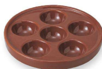
514-603-603 2,630円 茶色エスカルゴ 6穴 (16.2×2.9)