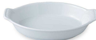
514-403-603 1,320円 白楕円22cmMグラタン (22×14.5×4.8)