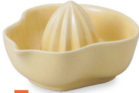
陶 522-101-303 1,300円 グレープフルーツ絞り (16×14×8.8)