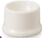
NB 522-102-033 1,050円 NB玉子立 (5.3×3.9×20cc)