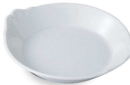
522-203-033 1,050円 白丸グラタンL (16×15×2.5・230cc)