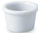
522-103-083 280円 5cmエッグスタンド (5.3×3.4)