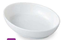
NB 522-105-033 630円 NBオーバルS (10.4×8.4×2.6・100cc)