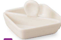
NB 522-104-033 1,650円 NB手付三角ジャム (9.2×9.2×4.8・80cc)