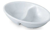
522-403-033 1,100円 白小判2切皿 (10.8×8×2.3・50cc)