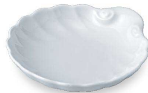
522-302-633 700円 YW12cmシェル皿 (12×11×2.7)