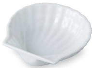
522-301-033 850円 白シェル(中) (11.4×11×3・150cc)