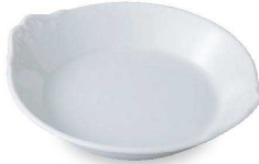
522-202-033 980円 白丸グラタンM (15×14×2・180cc)