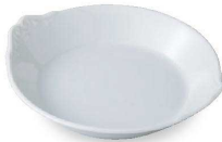
522-201-033 930円 白丸グラタンS (13.5×13×2・120cc)