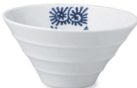
576-501-033 2,300円 唐草リネア18cm深ボール (18.2×9.2-1000cc)