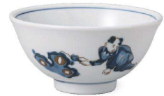
576-204-603 1,370円 新唐子 スープ碗 (11.7×5.8-250cc)