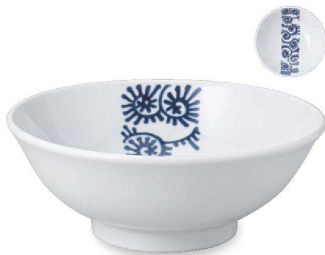
576-301-033 2,200円 唐草白中華反高台21cm井 (20.7×8.4-1250cc)