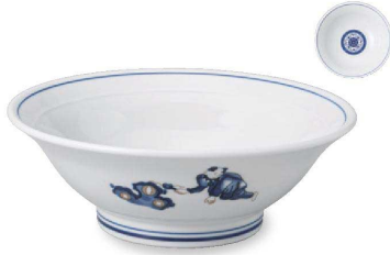
576-101-603 2,410円 新唐子 リム7.0高台井 (22×7.7-1050cc)