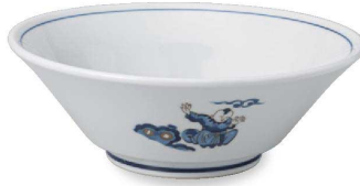
576-102-603 2,310円 新唐子 切立7.0井 (21×7.4-950cc)