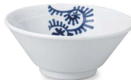
576-502-033 1,500円 唐草白中華リム15cmライス (14.9×6.4-430cc)