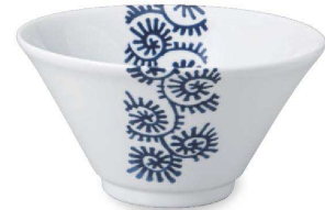
576-303-033 2,900円 唐草(内外)白中華切立19cm深井 (19×10.2-1200cc)