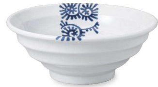
576-403-033 2,000円 唐草鳴門20cm井 (19.7×7.8-1000cc)