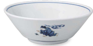
576-103-603 1,790円 新唐子 切立6.3井 (19.7×7-900cc)