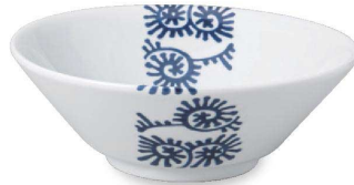
576-302-033 2,300円 唐草(内外)白中華切立20cm井 (19.6×7.2-910cc)