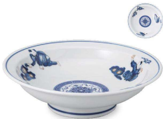
576-201-603 2,310円 新唐子 7.0丸高台皿 (21.5×6)