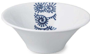
576-401-033 2,700円 唐草21cmボール (20.9×8-1000cc)