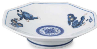
576-202-603 2,120円 新唐子 八角シューマイ皿 (9.3×8.2×4.7)