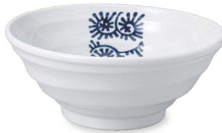
576-402-033 2,200円 唐草鳴門21cm井 (20.5×8.6-1300cc)