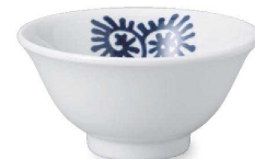
576-503-033 1,100円 唐草白中華反12cmボール (11.9×5.8-260cc)