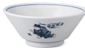
576-203-603 1,510円 新唐子 ライス井 (14.8×6.2-400cc)