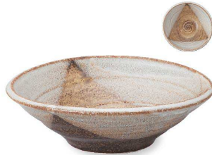
580-102-253 4,000円 黄河三方掛7.0富士型丼 (23×22.5×7・1250cc)