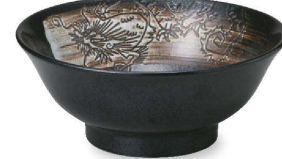
580-404-353 1,750円 中華雲龍6.8ラーメン (21.5×9・1300cc)