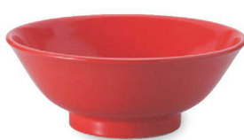
580-302-633 2,200円 高台7.0丼(赤) (21.4×8.6・1400cc)