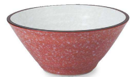
580-401-403 1,840円 翔陽ラーメン鉢 (19.7×9・1100cc)