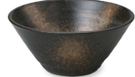
580-206-523 2,100円 月の輪6.5水輪めん丼 (19.8×9・1260cc)