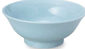
580-402-263 1,700円 青磁7.0反高台丼 (21.5×9・1320cc) 580-403-263 1,500円 青磁6.5反高台丼 (20×8・1200cc)