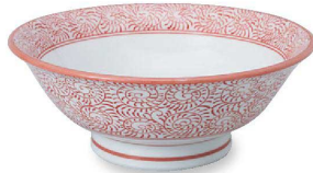
580-203-603 2,640円 たこ唐草(赤)7.0反り高台丼 (21.6×8.4・1200cc) 580-204-603 2,580円 たこ唐草(赤)6.5反り高台丼 (20.2×8・1050cc)