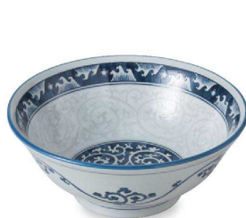
580-502-313 2,280円 波唐草6.8高台丼 (21.2×8.7・1360cc) 580-503-313 1,920円 波唐草6.3高台丼 (18.5×7.8・1000cc)