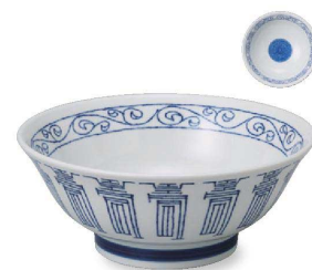
580-504-413 1,600円 中華青壽6.8ラーメン (21.5×9・1100cc)