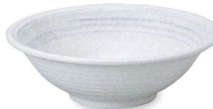
580-303-523 3,000円 ハケメ白雪8.0深鉢 (24×7.6・1550cc)