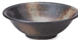
580-205-523 3,000円 月の輪8.0深鉢 (24×7.6・1550cc)