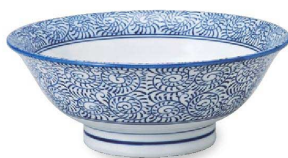
580-201-603 2,590円 たこ唐草7.0反り高台丼 (21.6×8.4・1200cc) 580-202-603 2,560円 たこ唐草6.5反り高台丼 (20.2×8・1050cc)