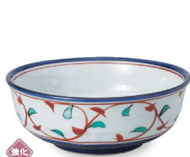
580-101-263 6,500円 手描き唐草6.8丼 (19.8×7.5・1280cc)