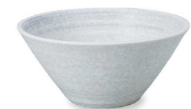
580-304-523 2,100円 ハケメ白雪6.5水輪めん丼 (19.8×9・1260cc)