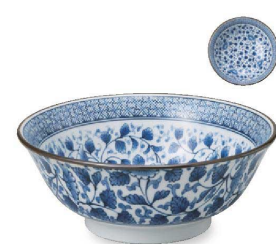
580-505-013 1,380円 藍染牡丹6.8ラーメン丼 (20.5×8・1200cc) 580-506-013 1,030円 藍染牡丹6.3ラーメン丼 (19×7.5・950cc)