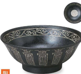
580-501-413 1,700円 中華黒壽6.8ラーメン (21.5×9・1100cc)