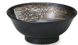
580-405-353 1,280円 中華雲龍6.3ラーメン (19.5×7.2・1000cc)