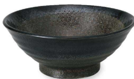
580-301-333 2,200円 結晶天目7.0麵丼 (20.5×8.3・1200cc)