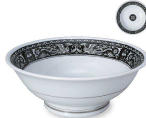
580-103-263 3,300円 鳳凰S7.0反高台丼 (21.9×8.4・1200cc) 580-104-263 3,000円 鳳凰S6.5反高台丼 (20.5×8・1060cc)