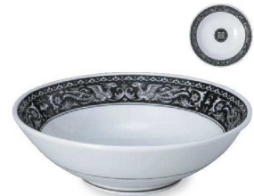
580-105-263 2,800円 鳳凰S6.8丸丼 (20.8×6.6・980cc) 580-106-263 2,500円 鳳凰S6.5丸丼 (19.5×7・900cc)