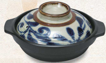
592-104-253 4,800円 ③ るり唐草5.5号土鍋 (19.7×16.7×9.5・420cc)