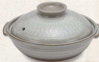
592-203-843 3,300円 ③ 京三島5.5京型鍋 (18.5×17×9)