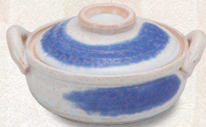
592-101-823 3,500円 ② フタ付グラタン鍋 (16.5×13×8)