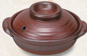
592-202-843 4,500円 ② 鉄赤(深)5.0鍋 (17.5×15×9)