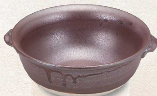
592-301-823 4,200円 ③ 超耐熱 鉄赤拉麺鍋 (23×21×8)