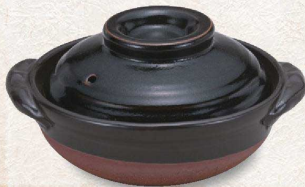
592-201-843 4,500円 ② ゆず天目5.0鍋 (17×15×8.5)