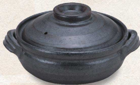
592-102-813 3,500円 ② 黒釉耐熱グラタン (16.5×13×8)