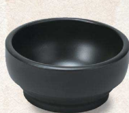
592-402-253 3,500円 ② スタックビビンバ黒16cm (16.2×7.7・900cc)