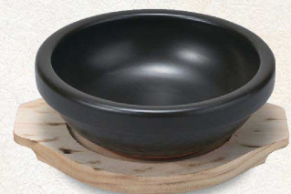
592-304-843 4,000円 ③ クロ耐熱ビビンバ鍋(20.3×7) 592-305-633 2,900円 (中国製) 19cm丸木台 (24×19×2・内径15.3)