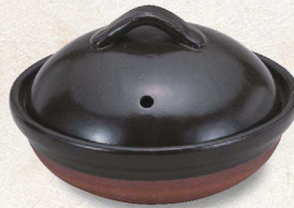
592-103-843 4,500円 ② 黒釉4.5蓋物鍋 (14.5×9.5)