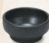
592-405-253 3,500円 ② スタッキングビビンバ黒石目16cm (16.2×7.7・900cc)