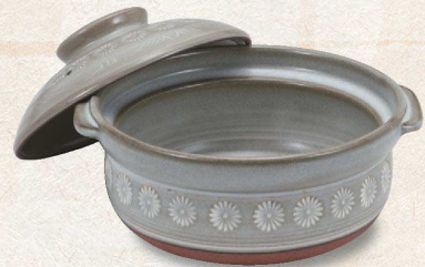
592-204-843 5,500円 ③ 花三島6.0深型鍋 (21×18.7×12)