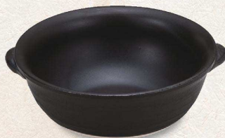
592-302-823 4,200円 ③ 超耐熱 漆黒拉麺鍋 (23×21×8)