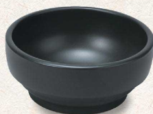
592-401-253 4,000円 ③ スタックビビンバ黒18cm (18×7.9・1150cc)