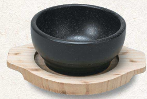
592-406-253 3,000円 ① スタッキングビビンバ黒石目14cm (14×6.5・530cc) 592-407-633 2,200円 (中国製) 14.5cm丸木台 (19.6×14.5×2・内径10.7)