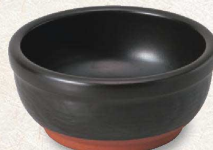
592-303-843 3,500円 ② クロ耐熱ミニビビンバ鍋 (15×6.5)