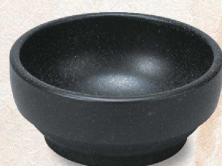
592-404-253 4,000円 ③ スタッキングビビンバ黒石目18cm (18×7.9・1150cc)