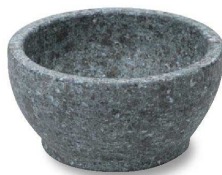
594-301-633 6,500円 2 14cm石鍋(14×7.5)