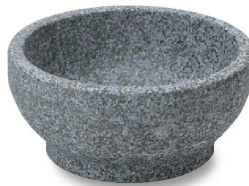
594-302-633 7,000円 2 16cm石鍋(16×7.5)