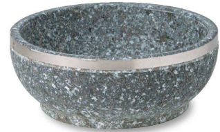
594-204-633 9,000円 3 21cm石鍋(ステンレス巻)(21×7.8)