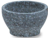
594-101-633 5,700円 1 12cm石鍋(12×6.5)