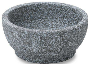
594-401-633 7,800円 3 18cm石鍋(18×7.5)