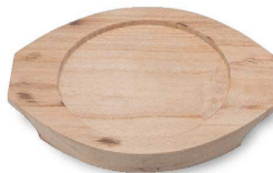
中国製 594-502-633 2,600円 16cm丸木台(20×16×2-内径12.8)