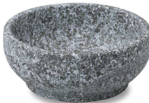
594-402-633 8,200円 3 20cm石鍋(20×7.5)