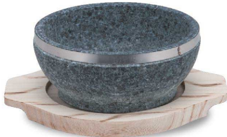
594-201-633 8,300円 3 18cm石鍋(ステンレス巻)(18×7.5) 594-202-633 2,900円 中国製 19cm丸木台(24×19×2-内径15.3)