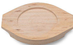
中国製 594-501-633 2,200円 14.5cm丸木台(19.6×14.5×2-内径10.7)