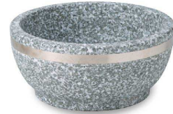
594-104-633 7,500円 2 16cm石鍋(ステンレス巻)(16×7.5)