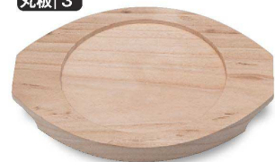
中国製 594-503-633 2,900円 19cm丸木台(24×19×2-内径15.3)

P595に使用上の注意がございますので、ご覧ください。 ※ [中国製] 以外の商品は韓国製です。