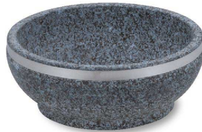
594-203-633 8,700円 3 20cm石鍋(ステンレス巻)(20×7.7)