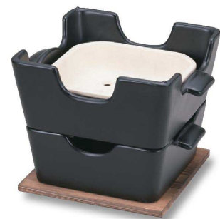
596-406-813 6,000円 耐熱水コンロ角型(木台付) (19.5×19.5×16)