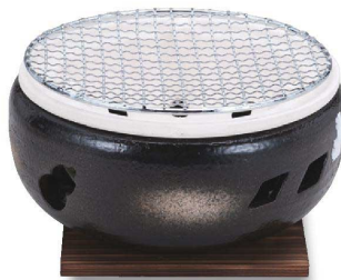
596-204-823 12,000円 灰釉水コンロ(小)(木台・網付) (19×8.8) 596-205-823 3,600円 7.0ゴトク (19.6×6.2) 596-206-823 2,900円 7.0全網19cm