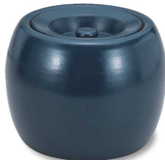
596-402-933 11,350円 火消し壺大々 (27×22) 596-403-933 9,800円 火消し壺大 (25×20) 596-404-933 9,000円 火消し壺中 (22×18.5) 596-405-933 8,300円 火消し壺小 (21×17)