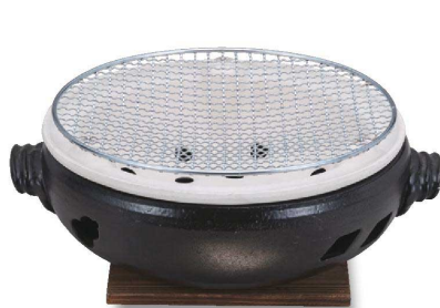
596-101-843 16,000円 灰釉手付9.0水コンロ(木台・網付) (32×27×11) 596-102-843 6,500円 9.0ゴトク (28.5×8) 596-103-843 3,200円 9.0水コンロ用アミ (26)