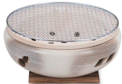
596-107-843 19,000円 志野10.0水コンロ(木台・網付) (29.5×11.5) 596-108-843 8,000円 10.0ゴトク (29.5×8.5) 596-109-843 3,600円 10.0水コンロ用アミ (29)