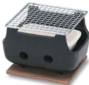
596-301-843 11,000円 (小)串焼水コンロ(木台・網付) (18×13.5×11)