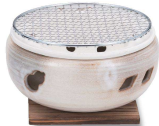
596-207-843 12,000円 志野7.0水コンロ(木台・網付) (19×8.8) 596-208-843 3,600円 7.0ゴトク (19.6×6.2) 596-209-843 2,900円 7.0水コンロ用アミ (19)