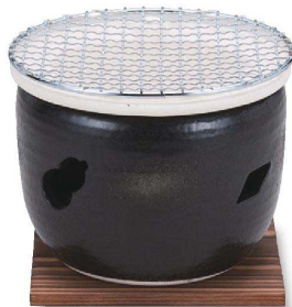
596-201-823 6,400円 灰釉ミニコンロ(木台・網付) (16.8×11.8) 596-202-823 2,000円 5.0ゴトク (19.6×6.2) 596-203-823 2,000円 5.0全網17cm