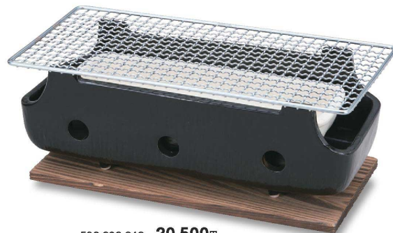
596-302-843 20,500円 (大)串焼水コンロ(木台・網付) (32×14.8×11.2)