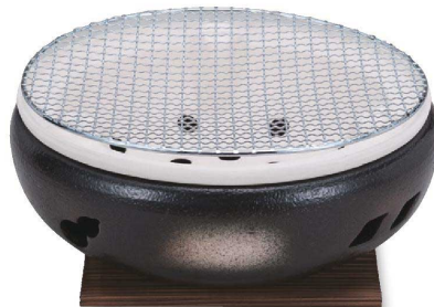
596-104-823 19,000円 灰釉水コンロ(大)(木台・網付) (29.5×11.5) 596-105-823 8,000円 10.0ゴトク (29.5×8.5) 596-106-823 3,600円 10.0全網29cm