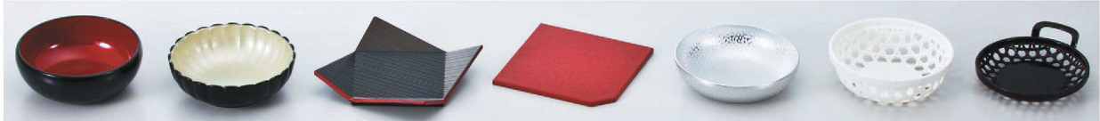
626-601-983 750円 丸小鉢 黒内朱 (11.2×4)