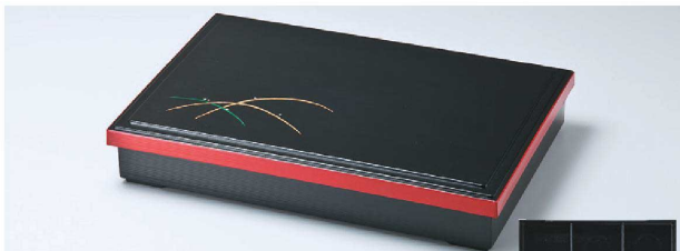
626-301-983 5,500円 13.0 舟線線筋松花堂 黒縁朱 露草(六っ仕切) (38×26×6.7)