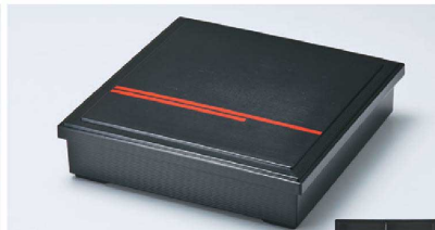
626-202-983 3,900円 8.5 筋入松花堂 黒 朱ライン(十字仕切付) (26×26×6.4)