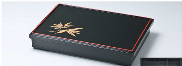
626-302-983 6,050円 13.0 筋入松花堂 黒天朱 金笹(六っ仕切) (38×26×6.7)