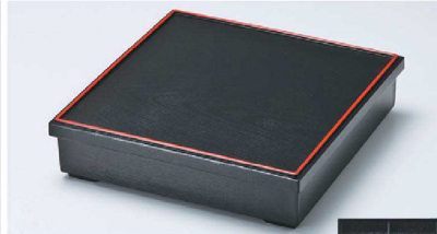
626-102-983 2,700円 8.5 木目紐付松花堂 黒天朱(十字仕切付) (25.8×25.8×6.4)