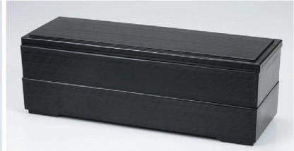
626-103-983 1,900円 山河弁当 黒(親) (37.5×12.8×6) 626-104-983 1,700円 山河弁当 黒(蓋) (37.5×12.8×1.8) 626-105-983 1,000円 山河弁当 黒(仕切) (36×11.5×4.3)