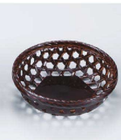
626-404-983 1,600円 丸籠鉢 溜 (11.1×3.6)