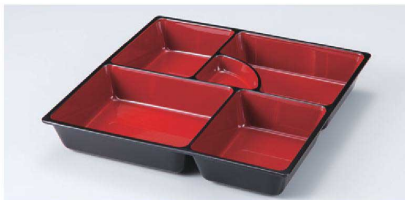
626-401-983 1,400円 8.5 松花堂用一枚仕切 朱天黒 (23.4×23.4×3.7)