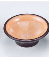
626-403-983 1,250円 すり鉢 クリーム (12×4.3)