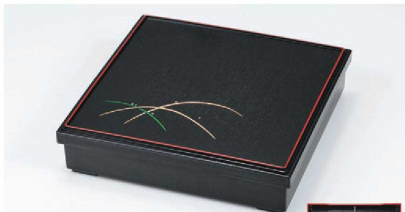
626-201-983 4,100円 8.5 加賀弁当 黒天朱 露草(十字仕切付) (26×26×6.2)