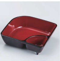
626-405-983 1,600円 扇鉢 朱天黒(タレ付) (11.1×11.1×3.5)