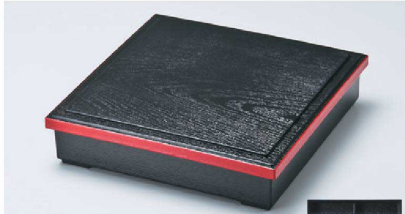
626-101-983 2,600円 8.5 木目松花堂 黒縁朱(十字仕切付) (26×26×6.3)