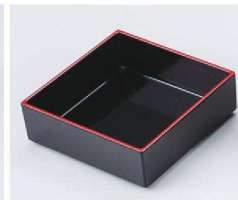
626-402-983 950円 角箱 黒天朱 (11.4×11.4×3.8)