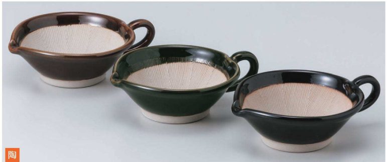
638-403-163 1,500円 ゴマだれ鉢(アメ) (15×11.7×4.7) 638-404-163 1,500円 ゴマだれ鉢(オリベ) (15×11.7×4.7) 638-405-163 1,500円 ゴマだれ鉢(天目) (15×11.7×4.7)