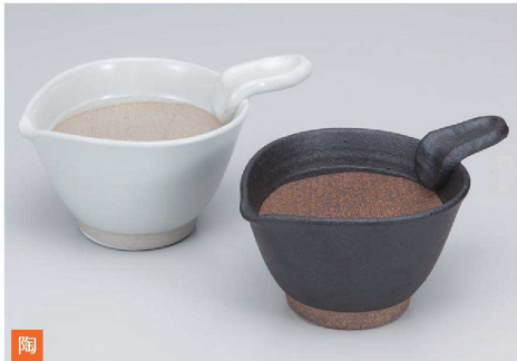
638-401-513 1,850円 乳白納豆鉢(大) (16.7×11.6×8.3) 638-402-513 1,850円 黒マット納豆鉢(大) (16.7×11.6×8.3)