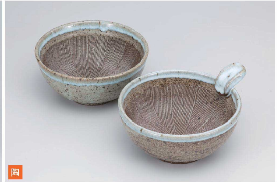
638-104-513 3,500円 ワラ灰掛丸5.5すり鉢 (16.3×7.5) 638-105-513 3,650円 ワラ灰掛手付丸5.5すり鉢 (19×16.3×7.5)