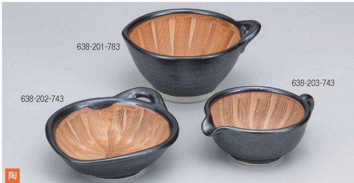
638-201-783 1,800円 黒釉納豆すり鉢 (15×13×6.8) 638-202-743 1,100円 黒釉三角すり鉢 (14.5×12.8×3.8) 638-203-743 1,100円 黒釉手付ドレッシング鉢 (12×10.3×5)