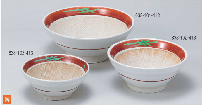
638-101-413 3,300円 赤絵6.0すり鉢 (19×7.5) 638-102-413 2,100円 赤絵5.0すり鉢 (15×6.8) 638-103-413 1,650円 赤絵4.0すり鉢 (12.5×5.5)