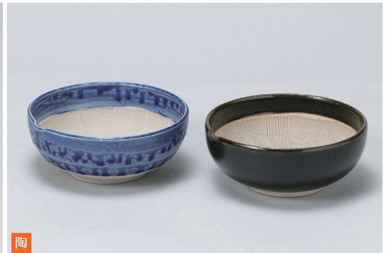
638-204-163 1,480円 口付丸型4.0スリ鉢(青イラボ) (11.6×4.8) 638-205-163 1,480円 口付丸型4.0スリ鉢(オリベ) (11.6×4.8)