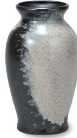
653-105-573 2,650円 吹き黒花瓶7号 (21)