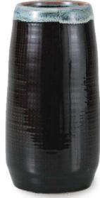
653-103-573 2,900円 布目天目花瓶 (9×22)