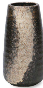
653-204-573 2,700円 茶吹き筒花瓶8号 (21)