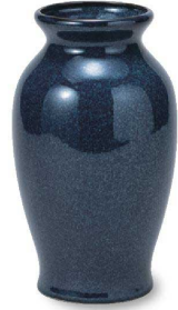
653-106-573 2,580円 ナマコ花瓶7号(21) 653-107-573 1,320円 ナマコ小花瓶(16)