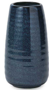
653-205-573 2,580円 ナマコ筒花瓶8号 (21)