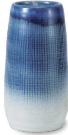
653-104-573 2,900円 布目白花瓶 (9×22)