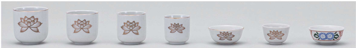
656-401-523 660円 白金蓮2.2湯呑 (6.7×6.8) 20入 656-402-523 570円 白金蓮2.0湯呑 (6.1×6) 20入 656-403-523 530円 白金蓮1.8湯呑 (5.7×5.8) 25入 656-404-523 430円 白金蓮1.6湯呑 (4.9×5.2) 30入 656-405-523 430円 白金蓮小出し (7×3.2) 60入 656-406-523 440円 白金蓮大深 (5.4×3.7) 70入 656-407-523 430円 錦小出し (7×3.2) 60入