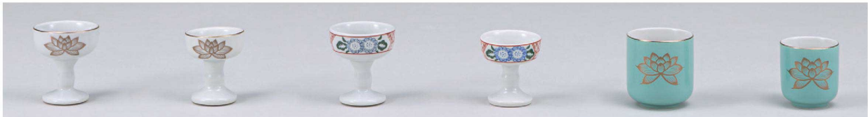
656-501-523 580円 白金蓮大仏器 (5.8×6.2) 25入 656-502-523 550円 白金蓮中仏器 (5×5.6) 30入 656-503-523 580円 錦大仏器 (5.8×6.2) 25入 656-504-523 550円 錦中仏器 (5×5.6) 30入 656-505-523 630円 青地金蓮1.8湯呑 (5.7×5.8) 25入 656-506-523 510円 青地金蓮1.6湯呑 (4.9×5.2) 30入