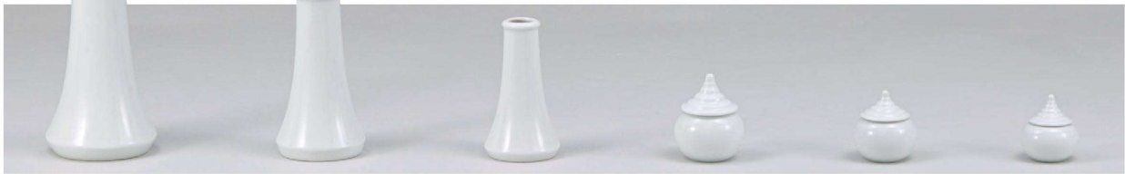
656-101-523 1,900円 白6.0禪立(18) 8入 656-102-523 880円 白5.0禪立(15.5) 20入 656-103-523 560円 白4.0禪立(12.5) 30入 656-104-523 770円 白2.0水玉(6.5×7.4) 20入 656-105-523 700円 白1.8水玉(5.2×6.6) 25入 656-106-523 670円 白1.5水玉(4.9×6.1) 30入