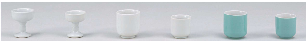
656-601-523 460円 白大仏器 (5.8×6.2) 25入 656-602-523 420円 白中仏器 (5×5.6) 30入 656-603-523 380円 白1.8湯呑 (5.7×5.8) 25入 656-604-523 320円 白1.6湯呑 (4.9×5.2) 30入 656-605-523 500円 青地1.8湯呑 (5.7×5.8) 25入 656-606-523 400円 青地1.6湯呑 (4.9×5.2) 30入