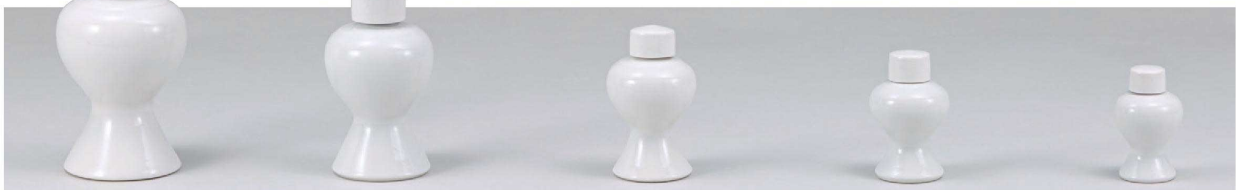
656-201-523 4,200円 白6.0平次(18) 656-202-523 2,500円 白5.0平次(16) 8入 656-203-523 1,100円 白4.0平次(12.7) 10入 656-204-523 940円 白3.5平次(10.5) 10入 656-205-523 860円 白3.0平次(9.2) 30入