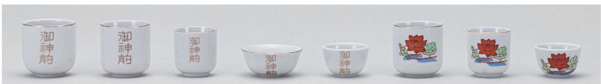
656-301-523 570円 御神前2.0湯呑 (6.1×6) 20入 656-302-523 530円 御神前1.8湯呑 (5.7×5.8) 25入 656-303-523 430円 御神前1.6湯呑 (4.9×5.2) 30入 656-304-523 430円 御神前小出し (7×3.2) 60入 656-305-523 440円 御神前大深 (5.4×3.7) 70入 656-306-523 530円 錦1.8湯呑 (5.7×5.8) 25入 656-307-523 430円 錦1.6湯呑 (4.9×5.2) 30入 656-308-523 440円 錦大深 (5.4×3.7) 70入