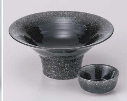
8-101-263 5,000円 南蛮金銀彩向付 (15.8×14.6×4.5) 8-102-263 2,700円 南蛮金銀彩千代口 (8.8×8×3.1)