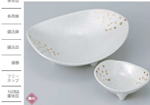
8-205-513 3,800円 緑袖カイヤギ刺身鉢 (14.5×4.7) 8-206-513 1,000円 緑袖カイヤギ千代口 (7.5×3.2)