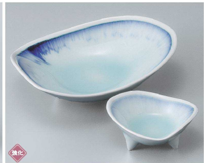
8-301-703 4,450円 金吹雪刺身鉢 (18.3×14.2×5.6) 8-302-703 1,680円 金吹雪千代口 (9.3×8×4)