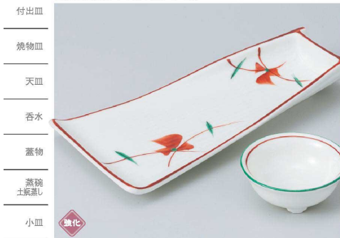
8-105-303 4,400円 コスモ (シルバー) 反高台向付 (17×8) 8-106-303 1,300円 コスモ (シルバー) 丸千代口 (6.7×3)