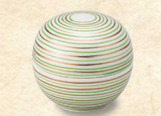
80-205-073 2,800円 グリーン駒筋丸蓋付珍味 (6.5×6)