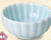
80-601-703 1,060円 青白磁菊型珍味 (6.5×3)