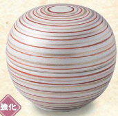
80-102-253 3,360円 朱コマ筋丸珍味 (6.5×6)