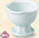
80-505-703 1,230円 青白磁梅型高台珍味 (6.3×5.4)