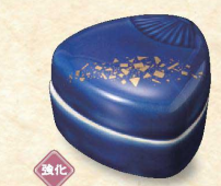
80-204-783 2,400円 ルリ金吹三角珍味 (6.7×6.7×4.9)