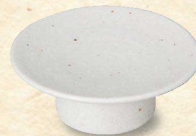
80-304-253 1,500円 粉引高台小皿 (8.2×3)