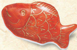
80-301-793 1,850円 金彩タイミニ小皿(12cm) (12×8×2)