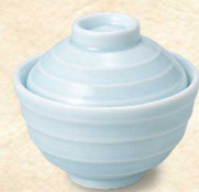
80-305-793 1,350円 スジ蓋物珍味 青磁 (7.5×6.8)