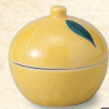
80-604-563 410円 ゆず型珍味(黄) (5.5×5.2)