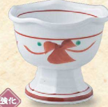
80-404-703 1,550円 赤絵小花高台珍味 (6.3×5.7)