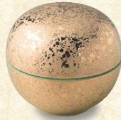
80-101-203 6,200円 金箔手まり珍味 (6.2×5.5)