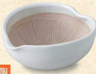
80-502-473 1,050円 乳白花びらりスリ珍味 (7.5×7×3.3)