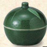
80-605-563 410円 ゆず型珍味(緑) (5.5×5.2)