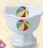
80-402-473 1,800円 朱磁夢風船梅型高台珍味 (6.5×5.7)