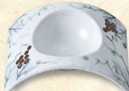
80-603-303 2,300円 白志野ぶどうアーチ型珍味 (12.8×10×4)