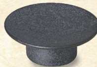
80-303-253 1,500円 いぶし高台小皿 (8.2×3)