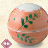
80-203-743 2,180円 赤絵萩珍味 (6.8×6.5)