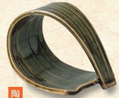
80-105-353 3,400円 手造り合わせ皿(小) 織部 (12×8×8)