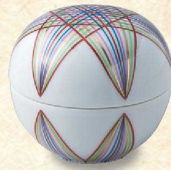
80-202-203 2,900円 手まり珍味 (6.2×5.5)