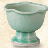
80-405-473 1,300円 ビードロ灰釉梅型高台珍味 (6.5×5.5)