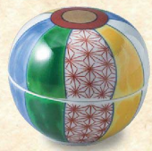
80-103-203 3,400円 風船珍味 (6.5×5.6)