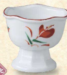
80-401-473 1,800円 花ひらり高台珍味 (6.5×5.7)