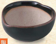
80-503-473 1,050円 天目花びらりスリ珍味 (7.5×7×3.3)