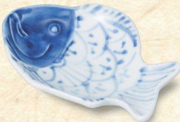
80-302-793 1,590円 染付タイミニ小皿(12cm) (12×8×2)