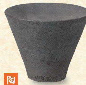
80-201-083 3,600円 炭化ハイプレートS細 (9×7.3)