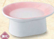
80-501-783 1,400円 ピンク吹高台珍味 (8.7×7×3.6)