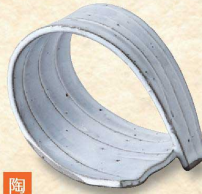
80-104-353 3,400円 白釉合わせ皿(小) (12×8×8)