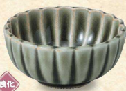
80-602-703 1,060円 織部菊型珍味 (6.5×3)