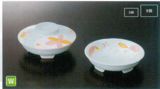
★M-225REA 14.5cm丸皿(身)(花かざり) 145×36 65 300cc ¥1,900 ★M-127REA 蓋(花かざり) 148×36 ¥1,150