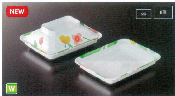
★M-905FOC 角皿(身)(フローラ) 173×135×29 64 230cc ¥1,580 ★M-906FOCS 角皿(蓋)(フローラ) 156×118×45 ¥1,380