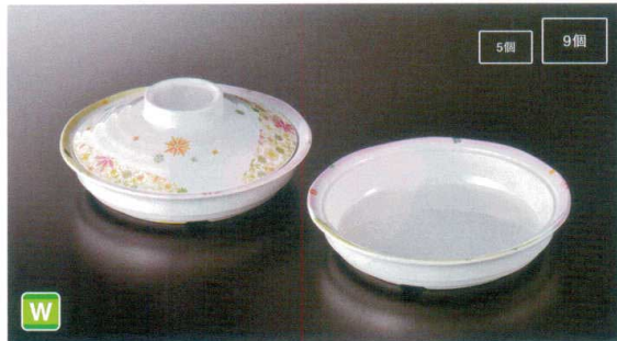
★M-901FOC 丸深皿(身)(花友禅) 166×34 65 310cc ¥1,620 ★M-902FOCS 蓋(花友禅) 148×42 ¥1,120 共用蓋A ●U-51AN丸すのこ(120頁掲載)が対応します。