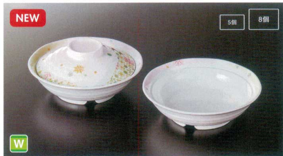
★M-903FOC 煮物碗(身)(花友禅) 172×50 76 330cc ¥1,930 ★M-902FOCS 蓋(花友禅) 148×42 ¥1,120 共用蓋A