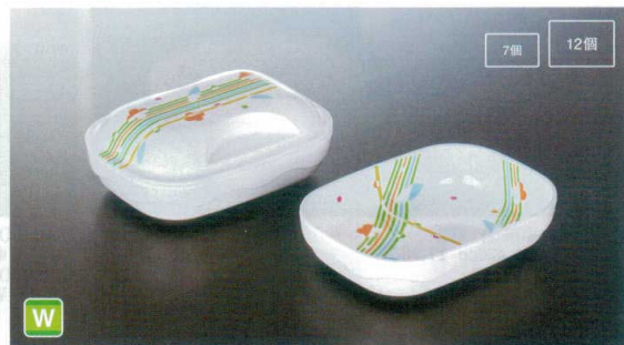
★M-409FOC 角皿(身)(彩虹) 166×122×38 62 420cc ¥2,160 ★M-410FOCS 角皿(蓋)(彩虹) 166×122×32 ¥1,680