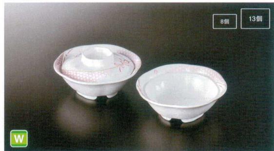
★M-427FOC 煮物碗(身)(福結) 136×47 65 190cc ¥1,430 ★M-428FOCS 煮物碗(蓋)(福結) 111×32 ¥890