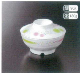
★M-606REK 飯碗(身)(カラフルミスト) 112×51 77 240cc ¥1,290 ★M-219REK 蓋(カラフルミスト) 113×30 ¥940 共用蓋 A