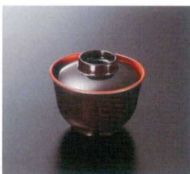
★M29001URS 吸物椀(身)(うるみ内朱) T23 96×62 77 230cc ¥620 ★F29001URS 吸物椀(蓋)(うるみ内朱) 84×26 ¥440