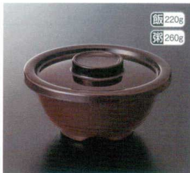
★M-203TMK 飯碗(身)(溜内黒) T23 138×63 75 490cc ¥1,130 ★M-204TMK 飯碗(蓋)(溜内黒) 147×20 ¥900