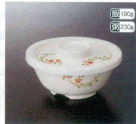
★M-205REA 飯碗(身)(奏艶) T23 134×58 71 420cc ¥1,290 ★M-206REA 飯碗(蓋)(奏艶) 143×20 ¥1,010