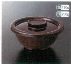
★M-205TMK 飯碗(身)(溜内黒) T23 134×58 71 420cc ¥1,060 ★M-206TMK 飯碗(蓋)(溜内黒) 143×20 ¥870