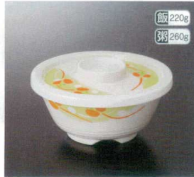
★M-203REA 飯碗(身)(花風) T23 138×63 75 490cc ¥1,360 ★M-204REA 飯碗(蓋)(花風) 147×20 ¥1,040