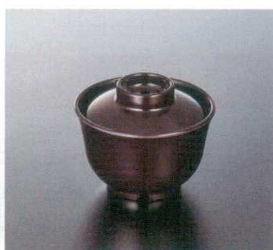
★M29001UR 吸物椀(身)(うるみ) T23 96×62 77 230cc ¥620 ★F29001UR 吸物椀(蓋)(うるみ) 84×26 ¥440

ココが Point 汁椀は配膳中に蓋が反転しにくいよう身の内側に段を設けた形状デザインです。