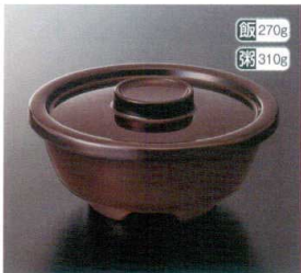
★M-201TMK 飯碗(身)(溜内黒) T23 150×64 77 610cc ¥1,270 ★M-202TMK 飯碗(蓋)(溜内黒) 159×20 ¥950