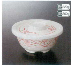
★M-203REB 飯碗(身)(京小花) T23 138×63 75 490cc ¥1,360 ★M-204REB 飯碗(蓋)(京小花) 147×20 ¥1,040