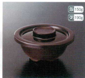
★M-241TMK 飯碗(身)(溜内黒) T23 122×53 65 320cc ¥970 ★M-242TMK 飯碗(蓋)(溜内黒) 134×19 ¥820