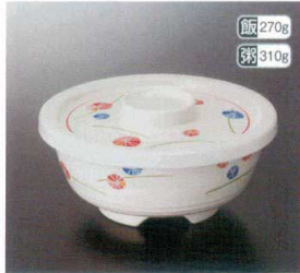
★M-201REA 飯碗(身)(撫子) T23 150×64 77 610cc ¥1,510 ★M-202REA 飯碗(蓋)(撫子) 159×20 ¥1,110