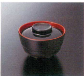
★M-223BKS 汁椀(身)(黒内朱) 107×60 69 280cc ¥760 ★M-224BK 汁椀(蓋)(黒) 96×25 ¥550