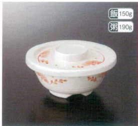
★M-241REA 飯碗(身)(淡彩花) T23 122×53 65 320cc ¥1,160 ★M-242REA 飯碗(蓋)(淡彩花) 134×19 ¥970