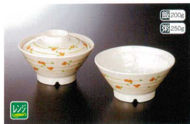
M-907NEAS 飯碗(身) ★140×69 ④89 450cc ¥2,150 M-908NEA 飯碗(蓋) ★124×37 ¥1,490