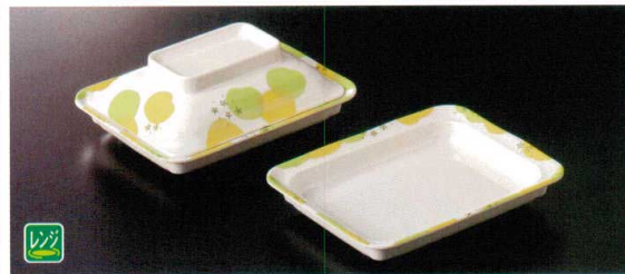
M-905NEAS 角皿(身) ★173×135×29 ④64 230cc ¥2,450 M-906NEA 角皿(蓋) ★156×118×45 ¥2,080