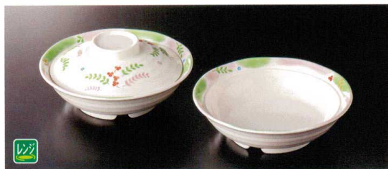
M-903NEAS 煮物碗(身) ★172×50 ④76 330cc ¥2,680 M-902NEA 蓋 ★148×42 ¥1,750 共用蓋A