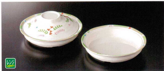
M-901NEAS 丸深皿(身) ●U-51AN丸すのこ(120頁掲載)が対応します。 ★166×34 ④65 310cc ¥2,490 M-902NEA 蓋 ★148×42 ¥1,750 共用蓋A