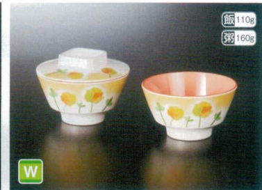
M21103YLK 飯碗(身) W 113×62 W 84 290cc ¥1,290 F21103YLK 飯碗(蓋) 114×29 ¥780