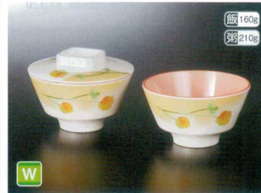
M21102YLK 飯碗(身) W 125×71 W 92 410cc ¥1,390 F21102YLK 飯碗(蓋) 127×29 ¥830