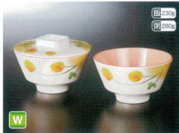
M21101YLK 飯碗(身) W 139×77 W 98 580cc ¥1,630 F21101YLK 飯碗(蓋) 141×28 ¥850