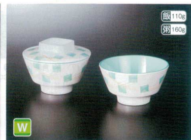
M21103KH 飯碗(身) W 113×62 84 290cc ¥1,290 F21103KH 飯碗(蓋) 114×29 ¥780