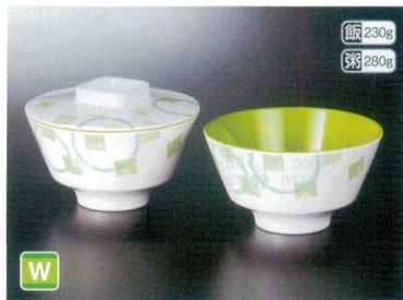
M21101KH 飯碗(身) W 139×77 98 580cc ¥1,630 F21101KH 飯碗(蓋) 141×28 ¥850