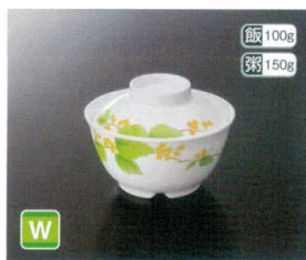
★GA-229SH 飯丼(身) T-3 109×56 ① 78 290cc ¥1,180 ★G-229FSH 飯丼(蓋) 96×30 ¥680