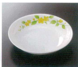
★G-473SH 18cm深皿 T-4 180×35 450cc ¥1,180 ② 296-OP ¥480 ① 67 ② 172頁