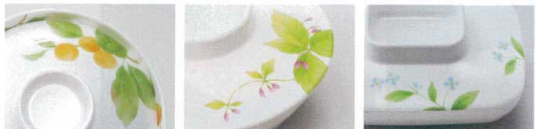
G-317・G-114 M-401・M-402/M-226・M-227 M-225・M-127/M-231・M-214 M-703・M-704