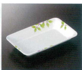
★M-136SH 角皿 T-3 182×113×27 ¥1,300 ② P-225 ¥570 ① 52 ② 176頁