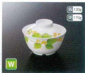
★GA-227SH 飯丼(身) T-4 115×59 ① 81 330cc ¥1,230 ★G-228SH 飯丼(蓋) 102×31 ¥690