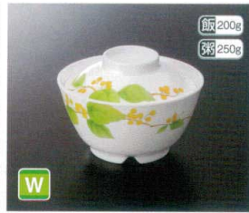
★GA-223SH 飯丼(身) T-3 130×69 ① 91 500cc ¥1,390 ★G-224SH 飯丼(蓋) 117×34 ¥700