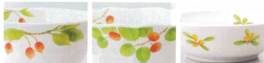
M-702・Y-142F/M-138 M-137・N-1602 M-228・G-467F/M-411・M-412