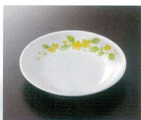
★G-477SH 16.5cm丸皿 T-3 165×29 ¥1,070 ② P-203 ¥470 ① 63 ② 172頁