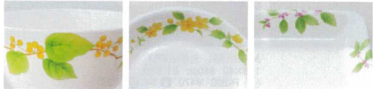
GA-221・G-222/GA-223・G-224 GA-225・G-226/GA-227・G-228 GA-229・G-229F G-473/G-477 M-136