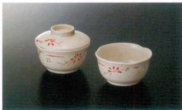
Y-141HM 丸小鉢(身) ㊦ 92×48 ㊦ 71 170cc ¥940 Y-141FHM 丸小鉢(蓋) 92×28 ¥710