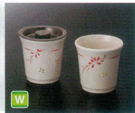
M-148HM 湯呑 79×79 ㊦ 83 210cc ¥1,150 M-149U こぼれにくい蓋(うるみ) 81×16 ¥550 ●M-149U こぼれにくい蓋はコーティングしてありません。