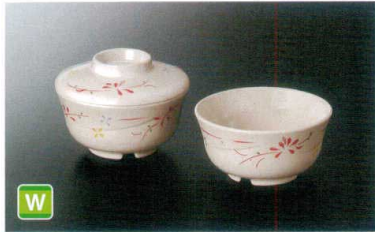
M-702HM 丸小鉢(身) ㊦ 110×55 ㊦ 79 280cc ¥1,250 Y-142FHM 丸小鉢(蓋) 110×31 ¥810 共用蓋 A