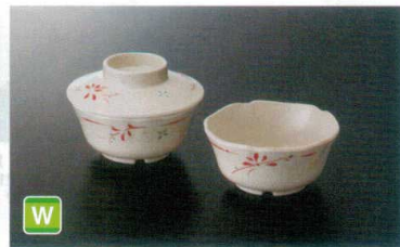
M-137HM 丸小鉢(身) ㊦ 100×47 ㊦ 72 200cc ¥1,110 N-1602HM 丸小鉢(蓋) 104×33 ¥770