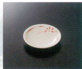
G-453HM 小皿 100×18 ¥520