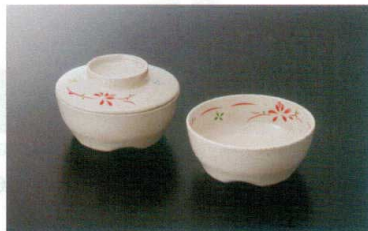
G-462HM 丸小鉢(身) ㊦ 100×40 ㊦ 60 190cc ¥940 G-462FHM 丸小鉢(蓋) 100×24 ¥720