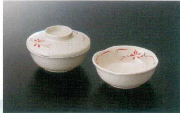
Y-142HM 丸小鉢(身) ㊦ 110×40 ㊦ 64 200cc ¥990 Y-142FHM 丸小鉢(蓋) 110×31 ¥810 共用蓋 A