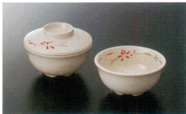
G-467HM 丸小鉢(身) ㊦ 110×50 ㊦ 76 280cc ¥970 G-467FHM 丸小鉢(蓋) 110×31 ¥810