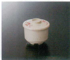
G-461Z むし茶碗(身)(石焼) ㊦ 76×60 ㊦ 73 180cc ¥730 C-61FHM むし茶碗(蓋) 84×18 ¥490