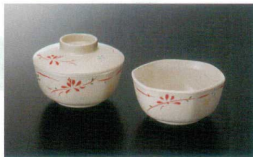
Y-152HM 六角小鉢(身) ㊦ 109×50 ㊦ 76 280cc ¥1,070 Y-152FHM 六角小鉢(蓋) 109×31 ¥810