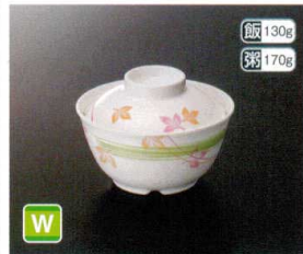
GA-227KM 飯井(身) T-3 115×59 81 330cc ¥1,230 G-228KM 飯井(蓋) 102×31 ¥690