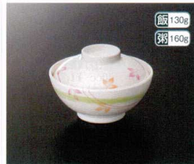
G-769KM 飯碗(身) T-3 118×53 79 300cc ¥1,060 G-770KM 飯碗(蓋) 110×33 ¥790