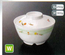
GA-221KM 飯井(身) T-3 140×74 98 650cc ¥1,530 G-222KM 飯井(蓋) 128×37 ¥760