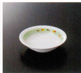
DP-116KM 13cm深皿 T-3 130×30 180cc ¥770 306-OP ¥420 T 74 揚 173頁