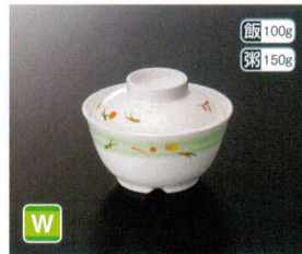
GA-229KM 飯井(身) T-3 109×56 78 290cc ¥1,180 G-229FKM 飯井(蓋) 96×30 ¥680