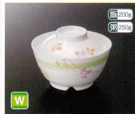
GA-223KM 飯井(身) T-3 130×69 91 500cc ¥1,390 G-224KM 飯井(蓋) 117×34 ¥700