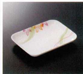
G-407KM 角皿 T-3 165×125×21 ¥1,180 299-OP ¥460 T 61 揚 176頁