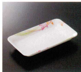
M-136KM 角皿 T-3 182×113×27 ¥1,300 P-225 ¥570 T 52 揚 176頁