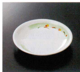
G-477KM 16.5cm丸皿 T-3 165×29 ¥1,070 P-203 ¥470 T 63 揚 172頁