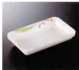
W-201KM 角皿 183×113×35 480cc ¥1,510 P-225 ¥570 T 60 揚 176頁